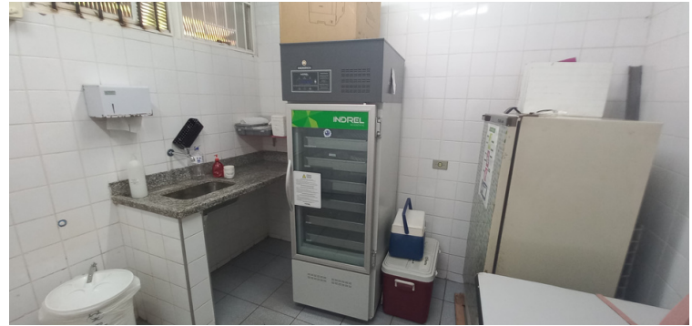
Foto 4 - Câmara fria avariada.