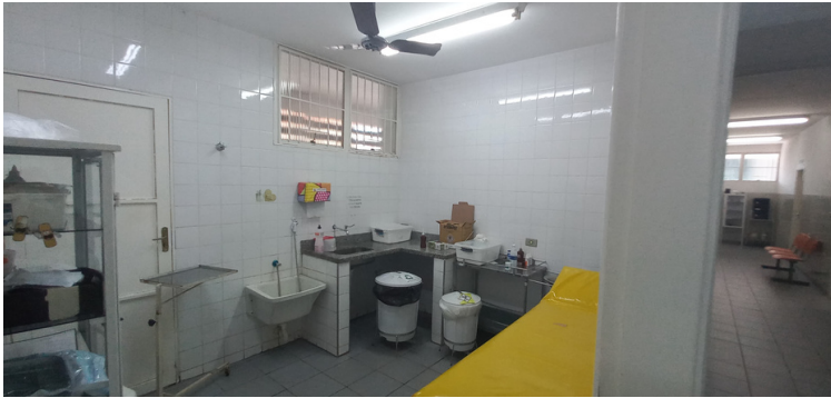
Foto 3 - Determinadas salas e consultórios com climatização ineficaz.