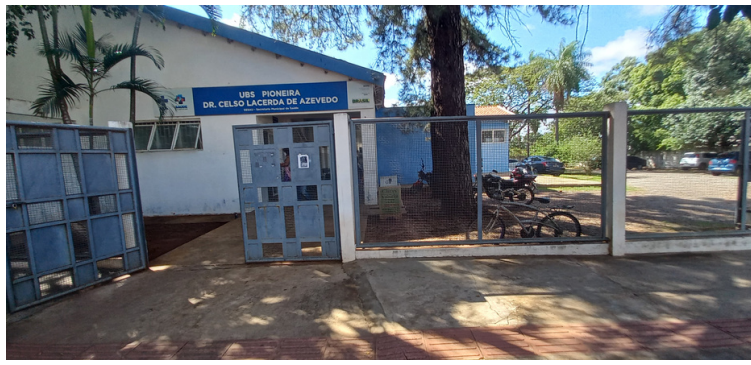
Foto 1 - Fachada da Unidade Básica de Saúde Dr. Celso Lacerda de Azevedo