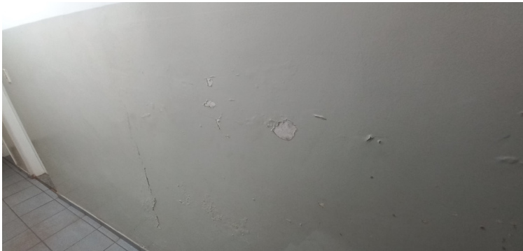
Foto 5 - Pintura externa e interna desgastada.