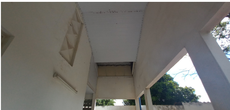
Foto 7- Estrutura do forro danificada.