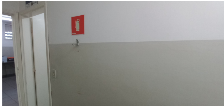
Foto 6 - Ausência de extintores em locais pontuais da unidade.