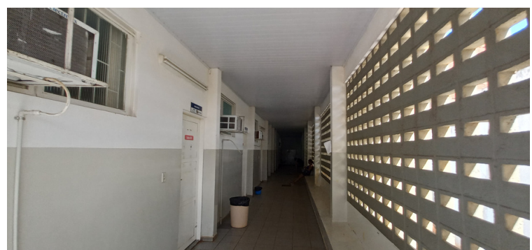
Foto 8 - Iluminação precária no corredor adjacente aos consultórios.