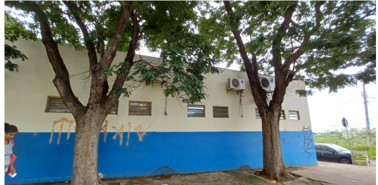
Foto 12 - Árvores vultosas comprometendo a calçada.