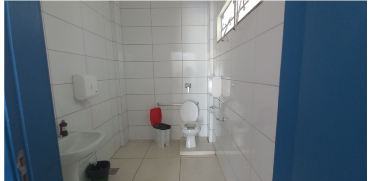
Foto 4 - Banheiros dos usuários limpos e com acessibilidade adequada.