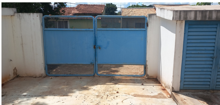
Foto 7- Portão de acesso ao estacionamento quebrado.