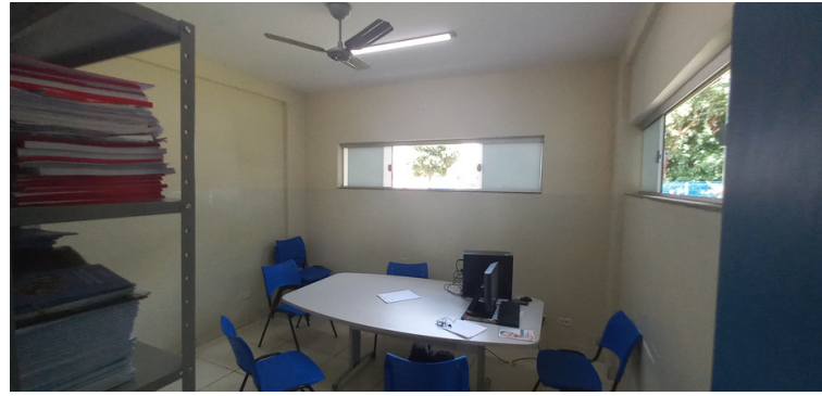
Foto 2 - Sala multiuso utilizado pelos ACS sem ar condicionado e somente um computador.