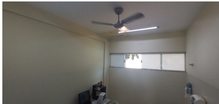
Foto 5 - Sala da enfermagem sem a adequada climatização.