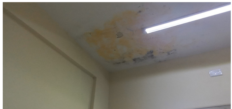
Foto 6 - Sala da enfermagem com pintura desgastada, infiltração e bolor aparente.