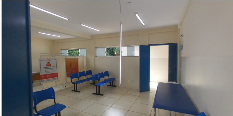
Foto 3 - Sala de reunião utilizada para testagem de Covid e com fiação exposta.