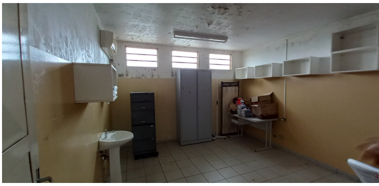
Foto 9 - Sala de enfermagem desativada devido ao bolor nas paredes e pintura deteriorada.