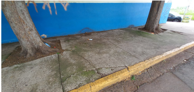
Foto 13 - Calçada de passeio comprometida.