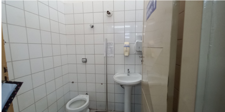
Foto 11 - Banheiro dos servidores sem lâmpadas e vaso sem tampa.