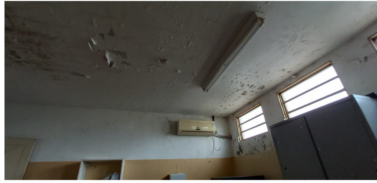
Foto 10 - Sala de enfermagem com luminárias e lâmpadas deficientes.