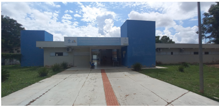
Foto 1 - Fachada da Unidade de Saúde da Família Arnaldo Estevão de Figueiredo.