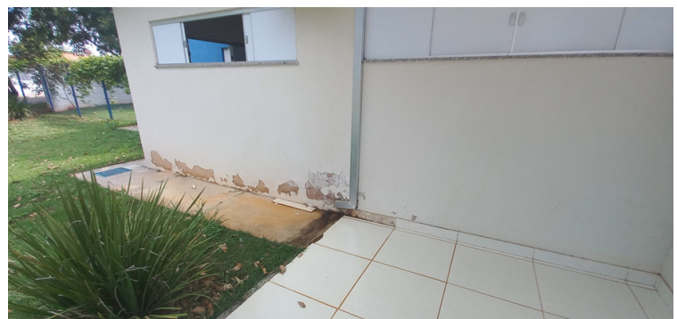
Foto 8 - Fachada externa necessitando de uma revitalização.