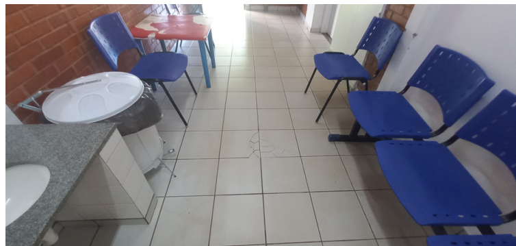
Foto 6 - Assoalho trincado desnivelando a estrutura do piso.