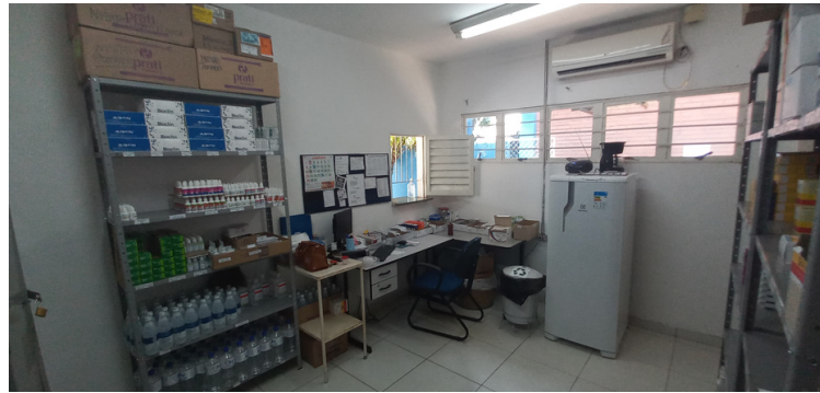
Foto 5 - Farmácia provida, estruturada e climatizada.