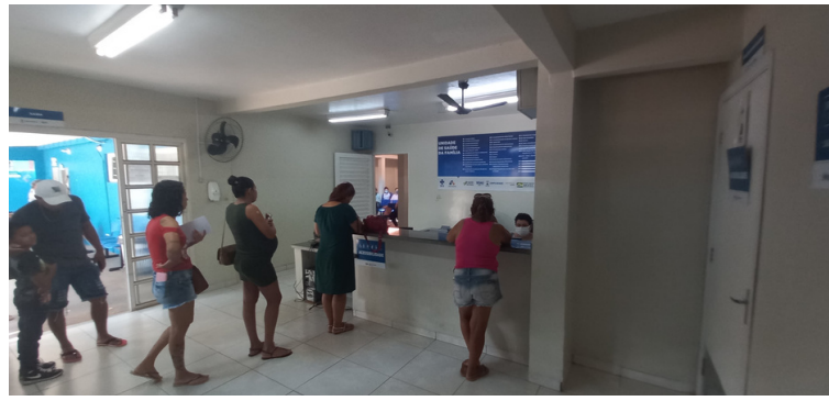
Foto 2 - Recepção com a climatização inadequada.