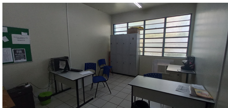
Foto 8 - ACS sem computadores para executarem suas funções.