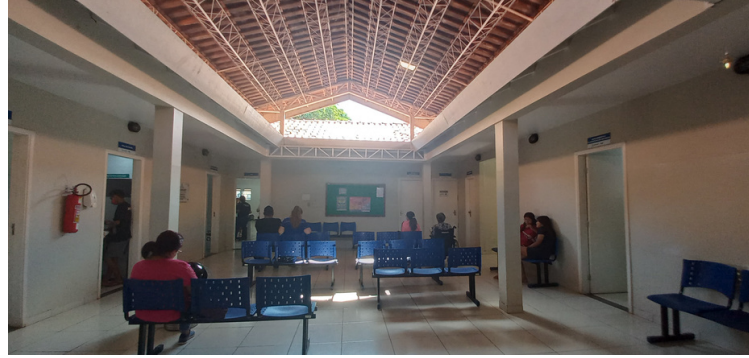
Foto 3 - Sala de espera com a estrutura arquitetônica que possibilita a entrada de água pluvial.