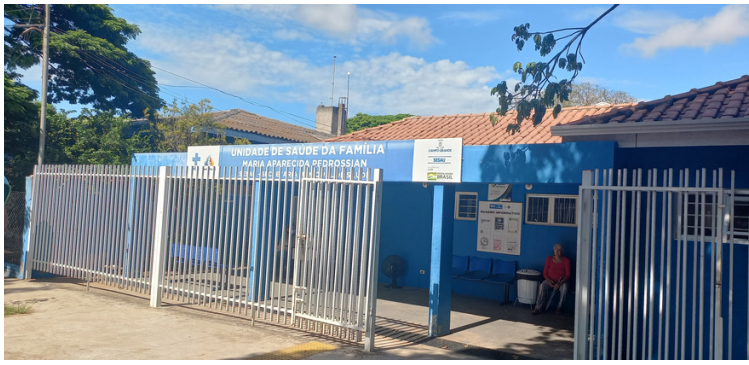
Foto 1 - Fachada da USF M ª Aparecida Pedrossian.