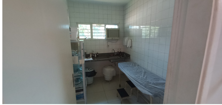
Foto 4 - Salas e consultórios devidamente climatizados.