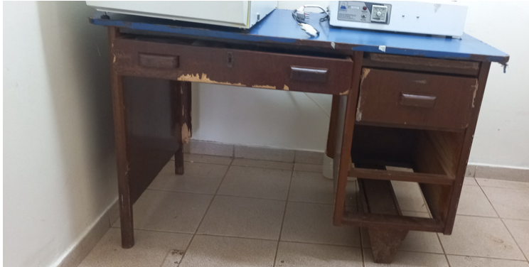
Foto 11 - Setor de esterilização com mesa avariada que sustenta a autoclave.