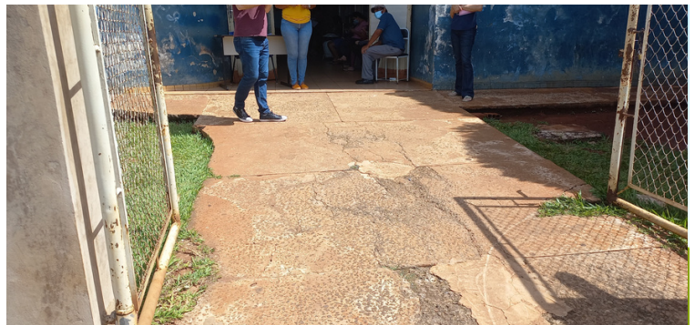
Foto 14 - A unidade não oferece acessibilidade apropriada.