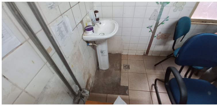
Foto 9 - Sala de triagem com ralo aberto e azulejos faltantes.