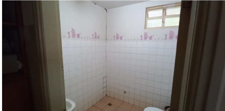
Foto 12 - Único banheiro de uso dos servidores com fissura aparente.