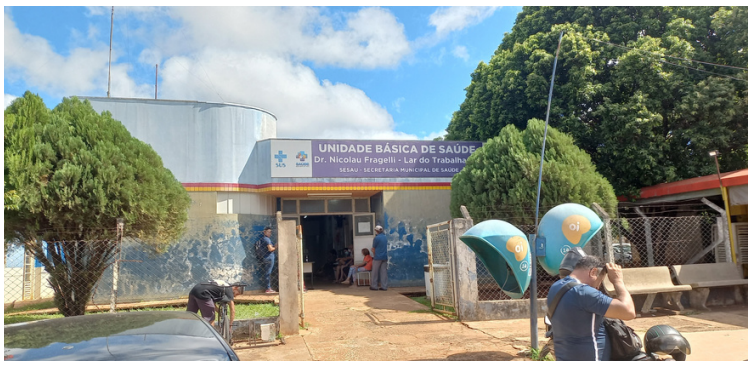
Foto 1 - Fachada da UBSF Dr. Nicolau Fragelli.