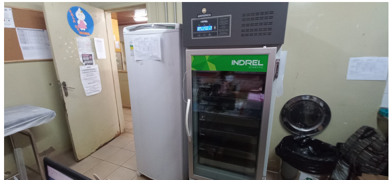
Foto 6 - Sala de vacinas com câmara fria estragada.