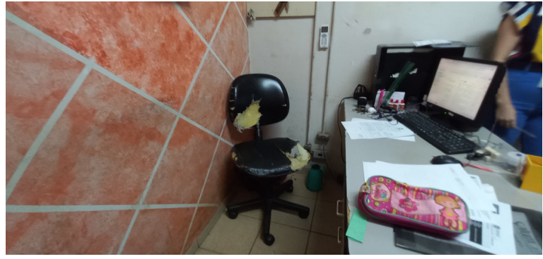
Foto 2 - Mobiliário da unidade extremamente avariado.