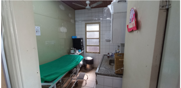
Foto 4 - Sala de curativo com falta de apropriada climatização e janela enferrujada.