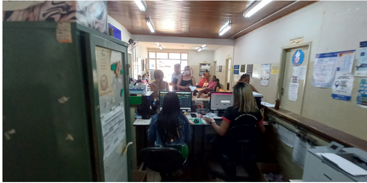
Foto 3 - Recepção com espaço insuficiente e sem climatização adequada.