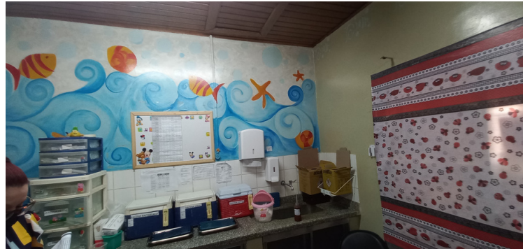
Foto 5 - Sala de vacina com vacinas acondicionadas em caixas térmicas.