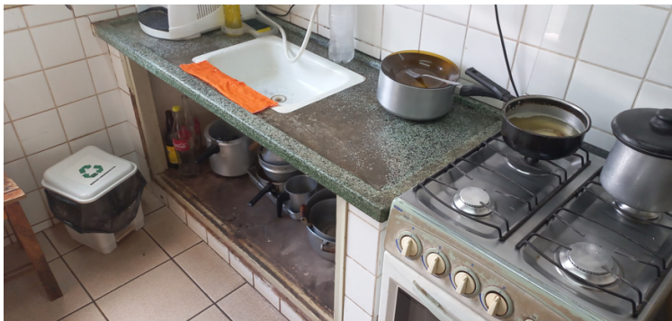
Foto 13 - Copa com armários estragados.