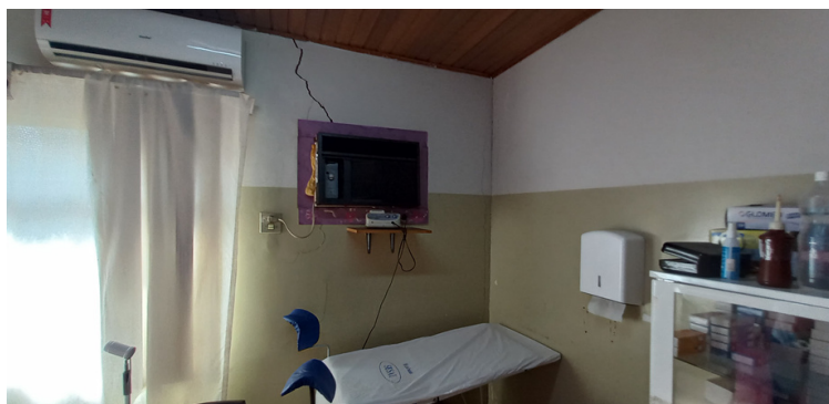
Foto 7 - Consultório de atendimento ginecológico com fissuras evidentes.