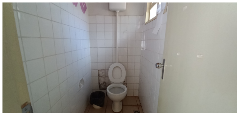
Foto 8 - Banheiro do consultório ginecológico com azulejo caído e mofo aparente.