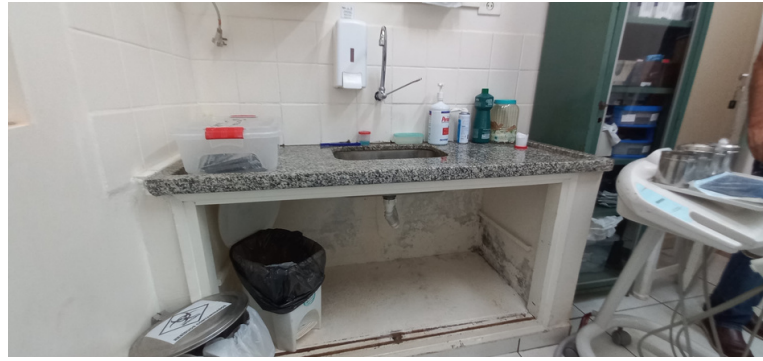
Foto 10 - Setor de Odontologia com paredes com pintura corroída e infiltração.