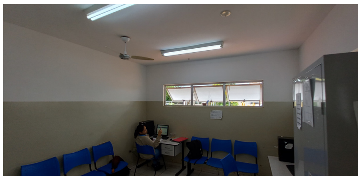
Foto 5 - Sala de multiuso utilizadas pelos ACS, com falta de equipamentos de informática.