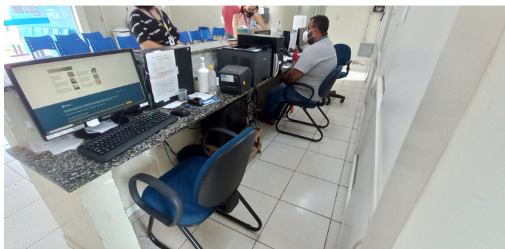
Foto 3 - Recepção com equipamentos de informática morosos e em número insuficiente.