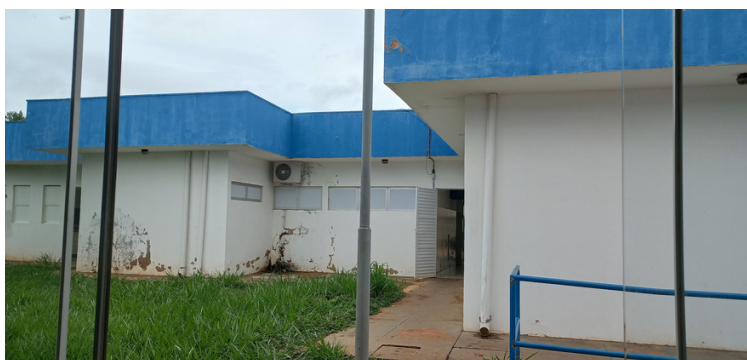
Foto 8 - Fachada externa carecendo de revitalização.