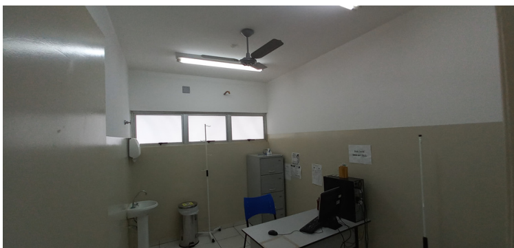
Foto 4 - Consultório sem a climatização adequada.