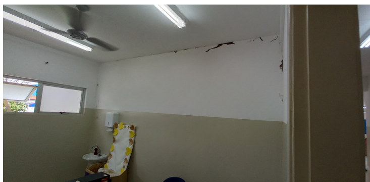
Foto 7 - Sala do serviço social com rachaduras evidentes.