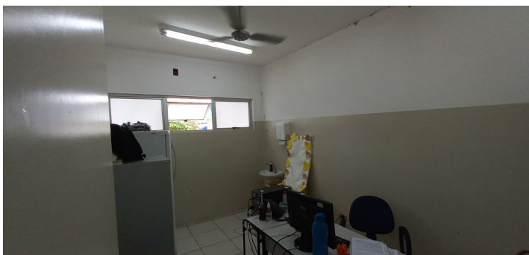
Foto 6 - Sala do serviço social sem a apropriada refrigeração.