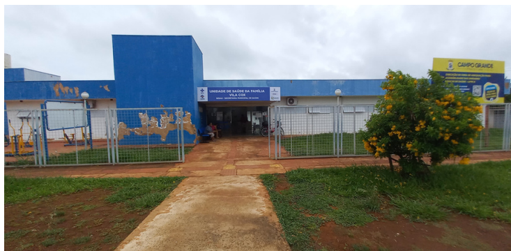
Foto 1 - Fachada da USF Vila Cox.