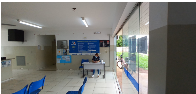
Foto 2 - Recepção sem a devida climatização.