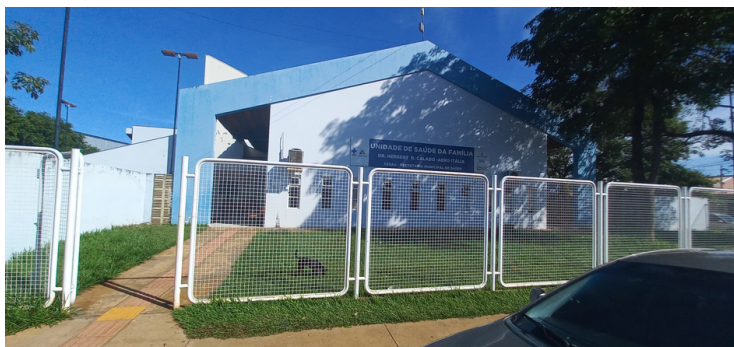
Foto 1 - Fachada da USF Dr. Herbert Rebelo Calado.