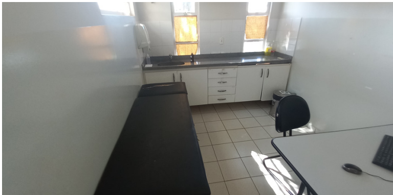
Foto 4 - Sala de classificação de risco com maca avariada.