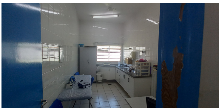
Foto 5 - Sala de coleta sem arrefecimento adequado.