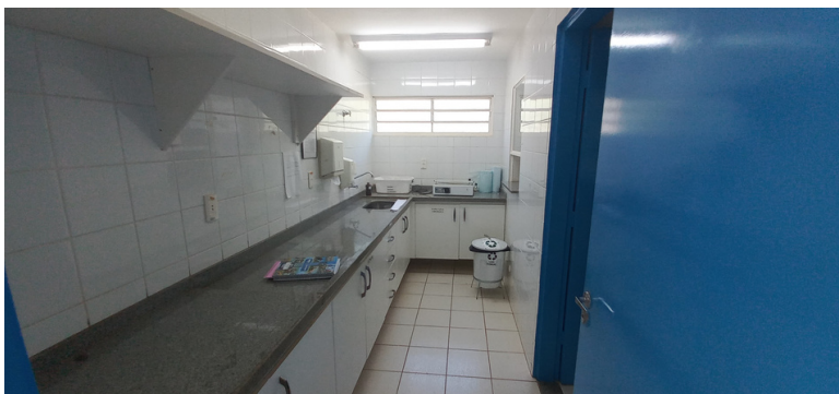
Foto 6 - Setor de esterilização com autoclave danificada.