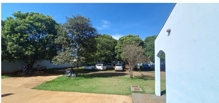
Foto 8 - Estacionamento sem iluminação.