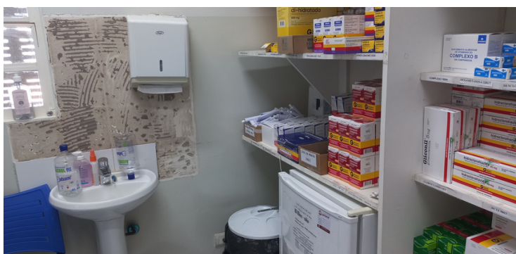
Foto 7 - Farmácia com azulejos caídos.