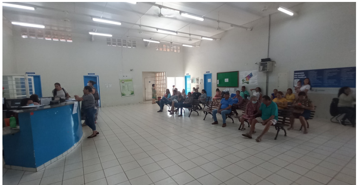
Foto 3 - Recepção sem a devida climatização.