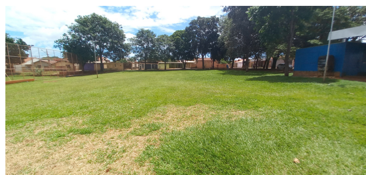
Foto 8 - Área verde satisfatoriamente conservada.