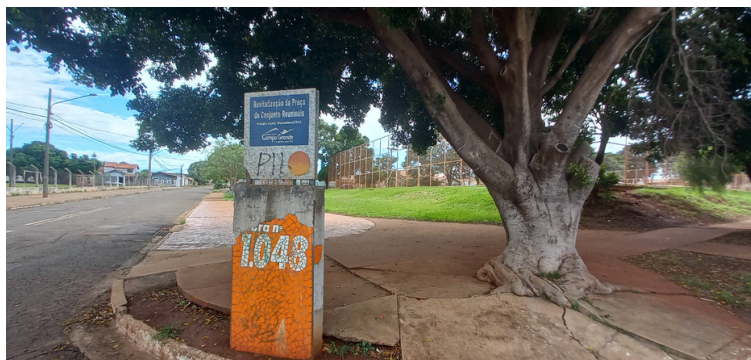
Foto 1 - Placa de identificação da praça, danificada.