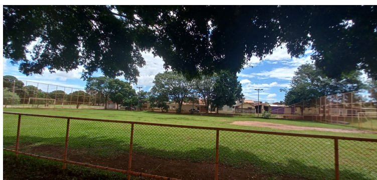
Foto 7 - Campo de futebol devidamente conservado e mantido.