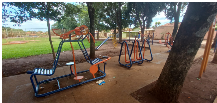
Foto 5 - Academia ao ar livre com equacionamentos danificados.