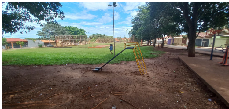
Foto 4 - Parquinho escasso de brinquedos.