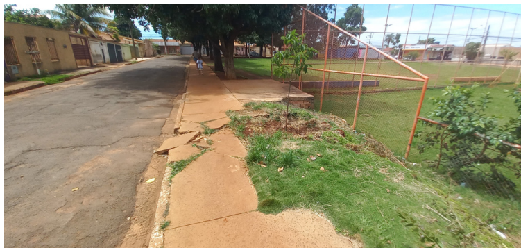
Foto 3 - Terreno acometido por erosão, prejudicando a estrutura da calçada.