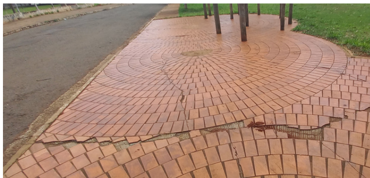
Foto 2 - Calçamento com lajotas se desprendendo.