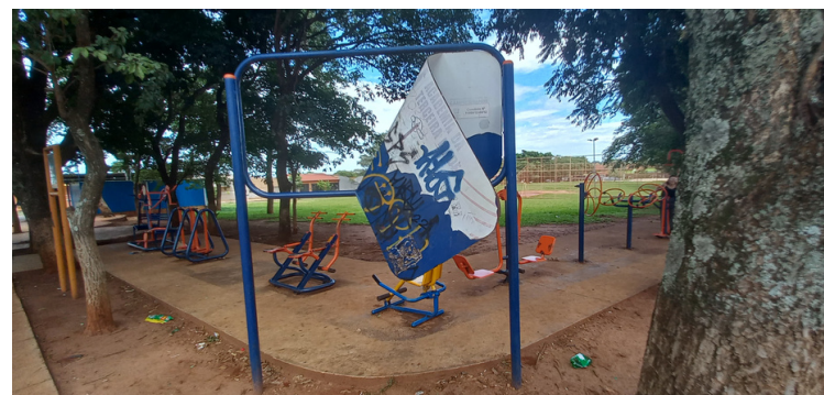
Foto 6 - Placa de orientação da academia, avariada.