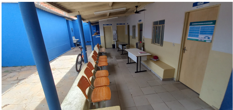
Foto 7 - A unidade não conta com sala de reunião, esta são realizadas neste espaço.