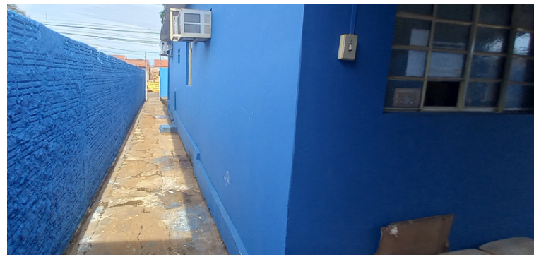
Foto 4 - Vidro que necessita de reposição.