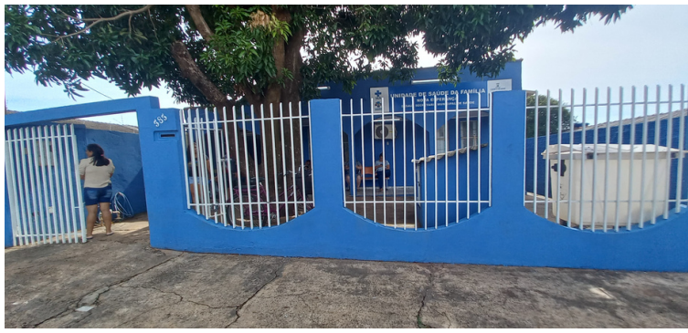
Foto 1 - Fachada USF Nova Esperança, Piratininga.