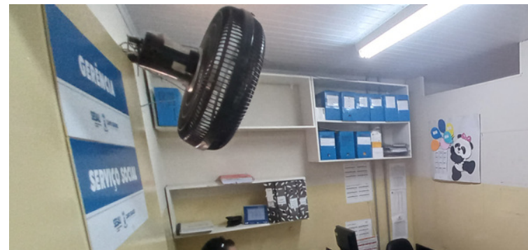
Foto 8 - Falta climatização adequada na unidade.