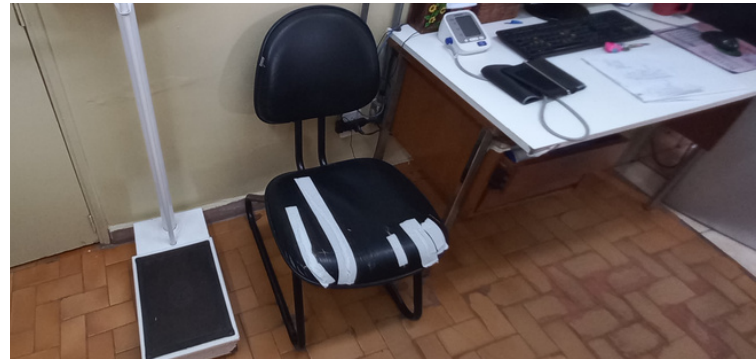
Foto 6 - Mobiliário avariado que aguarda reparo ou a troca.