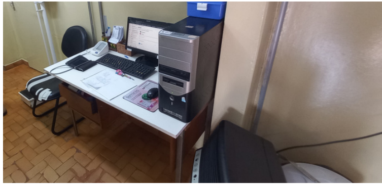
Foto 3 - Equipamentos de informática, morosos, obsoletos e em número insuficiente.