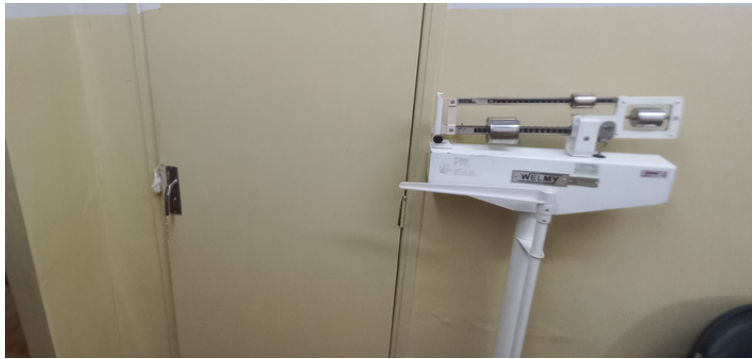
Foto 5 - Fechadura que carece de substituição.