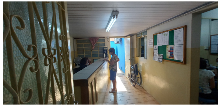
Foto 2 - Unidade com espaço diminuto.