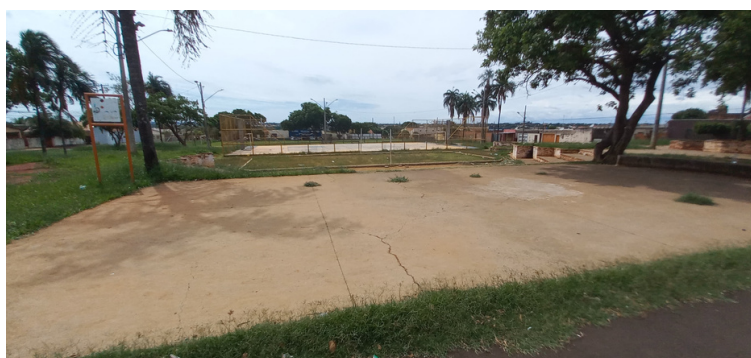
Foto 7 - Espaço para instalação de academia ao ar livre.