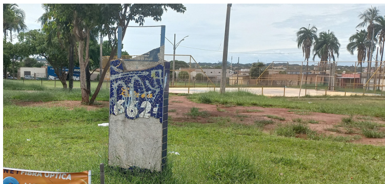
Foto 1 - Placa de identificação da praça depredada.