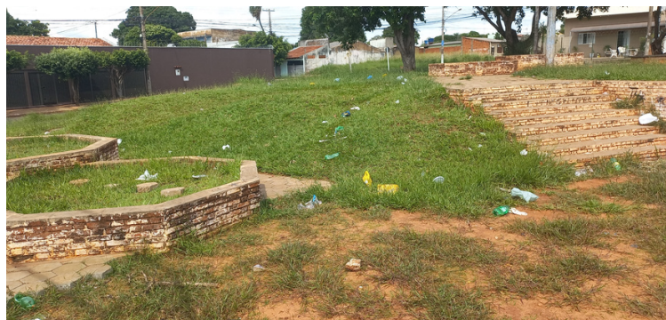
Foto 2 - Descarte irregular de lixo por toda a extensão da praça.