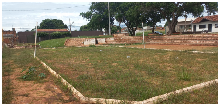
Foto 4 - Quadra de areia repleta de vegetação.