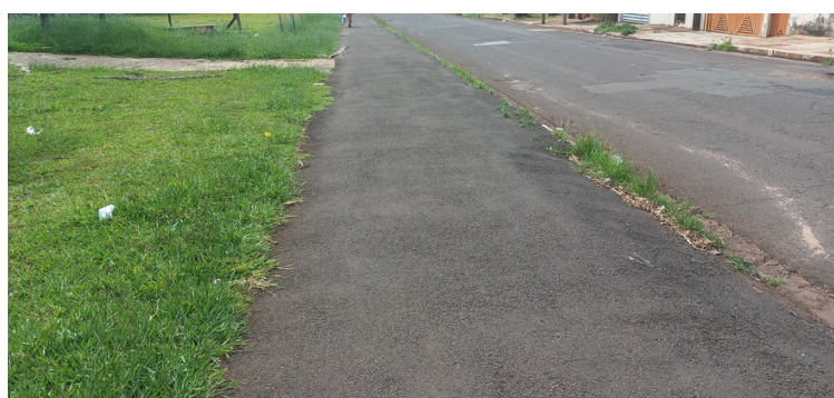
Foto 8 - Pista de caminhada adequada para uso.