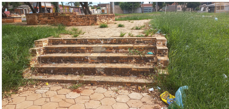
Foto 3 - Área verde sem manutenção.