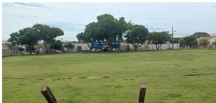
Foto 6 - Campo de futebol satisfatoriamente mantenido.