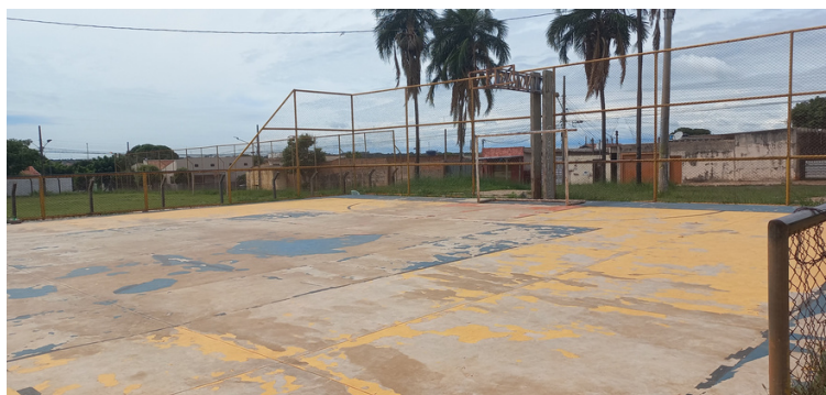
Foto 5 - Quadra esportiva com a pintura desgastada, piso danificado e alambrado avariado.