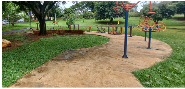
Foto 4 - Academia ao ar livre utilizada pelos frequentadores.