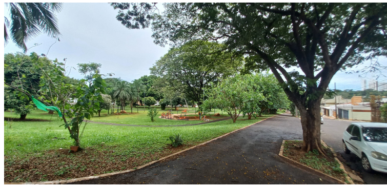
Foto 2 - Pista de caminhada com pavimento em bom estado.