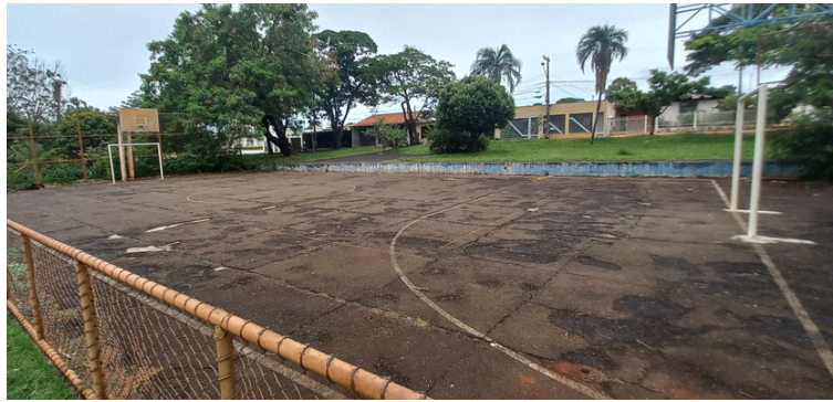
Foto 3 - Quadra de esportes com pintura danificada, com desníveis no pavimento e com falta de cestas para a prática de basquetebol.