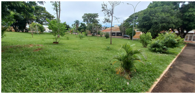
Foto 1 - Praça Coophafé, arborizada e bem conservada .