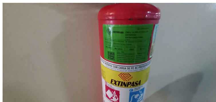
Foto 8 - Extintores com a data de validade vencida.