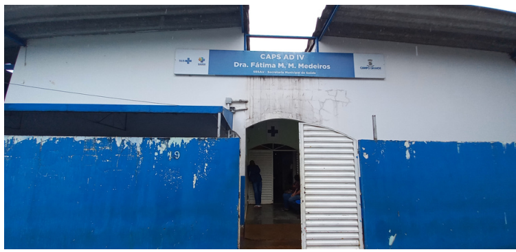
Foto 1 - Fachada do CAPS AD IV Dr.ª Fátima M. M. Medeiros.