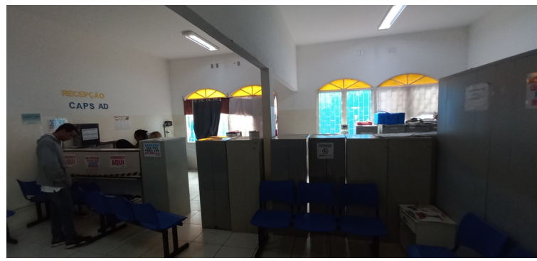
Foto 2 - Recepção isenta da devida climatização, de iluminação e de mobiliário.