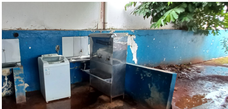
Foto 5 - Bebedouros avariados, sem a devida funcionalidade.