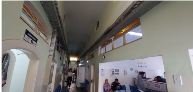
Foto 3 - Unidade escassa de iluminação adequada.