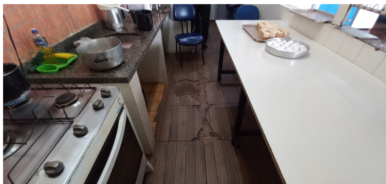
Foto 7 - Cozinha isenta de equipamentos adequados, escassa de mantimentos e estruturalmente desgastada.