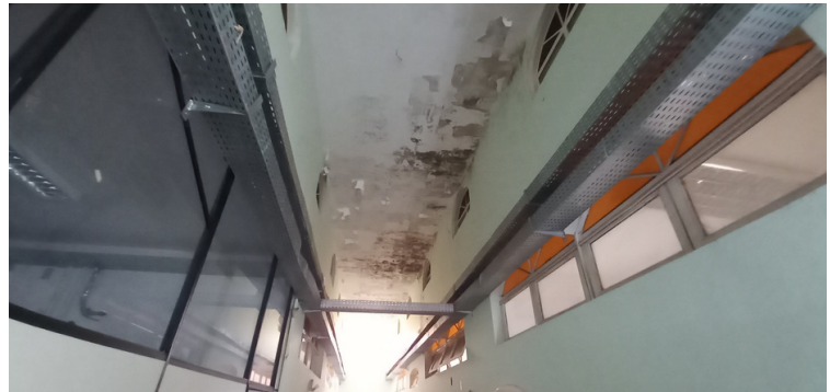
Foto 4 - Infiltração e mofo ocorrem em locais pontuais da unidade.