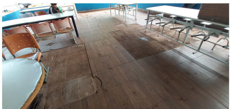
Foto 6 - Refeitório encontra-se com pisos e mobiliário danificados.