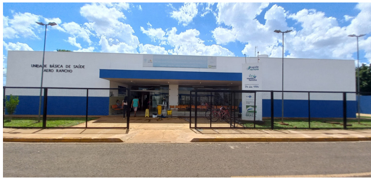
Foto 1 - Fachada da Usf Dr. Nelson Tokuei Simabukuro - Aero Rancho IV.