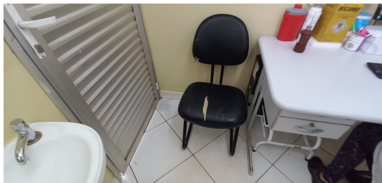
Foto 4 - Cadeiras avariadas, na precisão de conserto ou substituição.