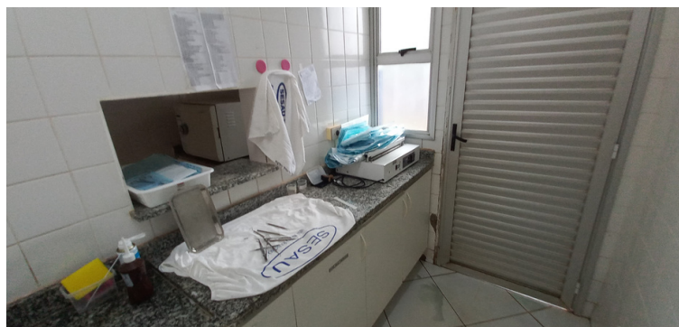
Foto 6 - Seladora danificada.