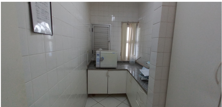
Foto 5 - Autoclave avariada.