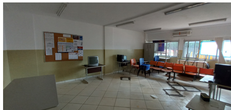
Foto 8 - Agentes comunitários utilizam a sala de reunião com a disponibilidade de apenas um computador.