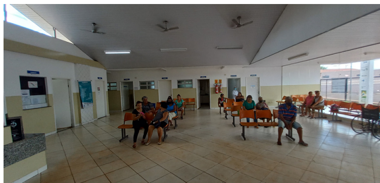
Foto 2 - Unidade devidamente climatizada em todas as salas e consultórios.