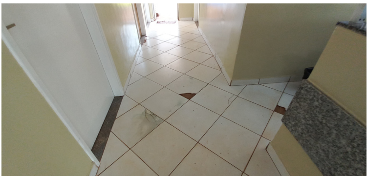
Foto 3 - Pisos quebrados ou faltosos, em processo de manutenção.