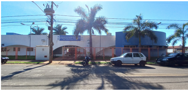
Foto 1 - Fachada da Unidade de Saúde da Família Dr. Hélio Martins Coelho.