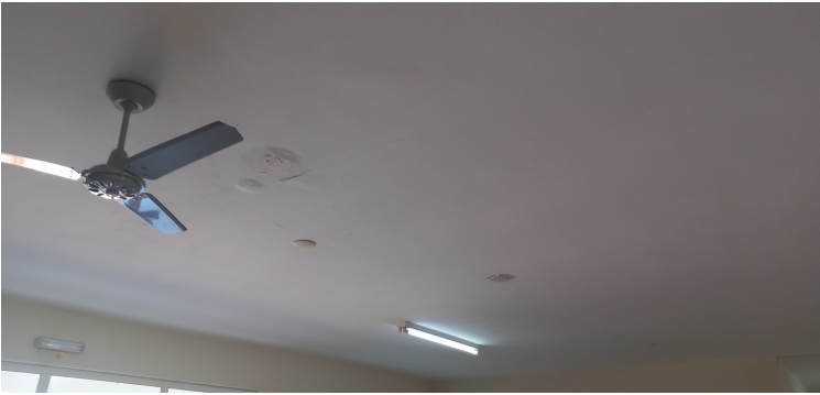
Foto 3 - Marcas de antigas infiltrações em locais pontuais da unidade.