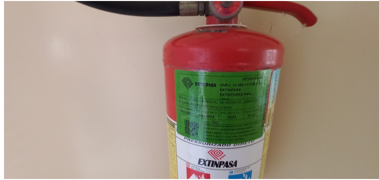
Foto 4 - Extintores com a data de validade expirada.