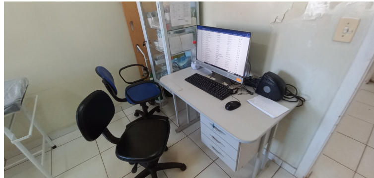
Foto 6 - Computadores e rede de internet compatíveis.