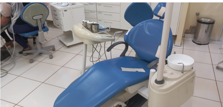
Foto 7 - Cadeira odontológica necessitando de conserto.