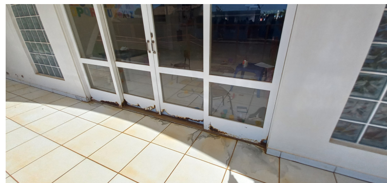
Foto 8 - Portas corroídas pela ferrugem.