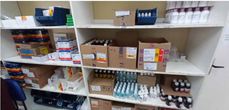
Foto 5 - Farmácia desprovida de medicamentos.