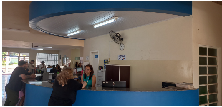
Foto 2 - Recepção com a climatização ineficiente.