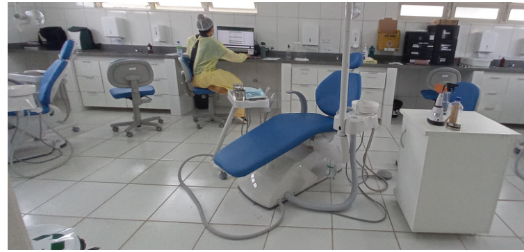
Foto 4 - Cadeira do setor de Odontologia apresentando vazamento.