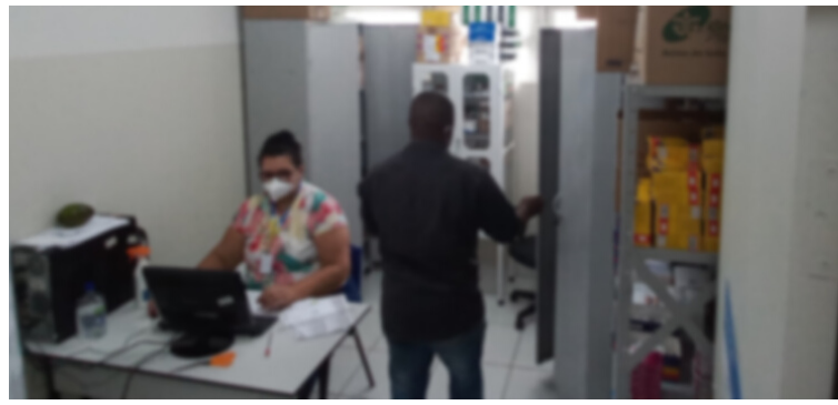
Foto 2 - Equipamentos de informática morosos e obsoletos.