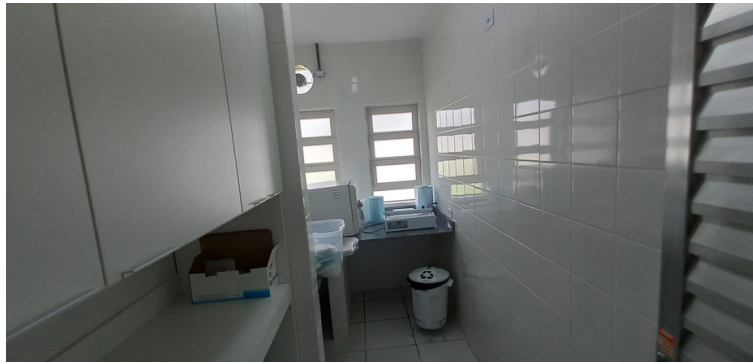
Foto 3 - Autoclave da unidade aguardando reparo.