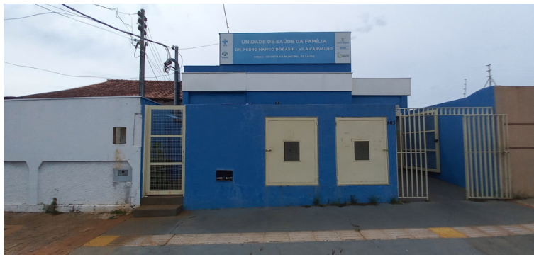
Foto 1 - Fachada da USF Dr Pedro Nango Dobashi, Vila Carvalho.