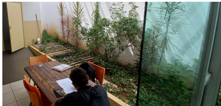
Foto 5 - Local disponibilizado aos ACS, não há nenhum equipamento de informática.