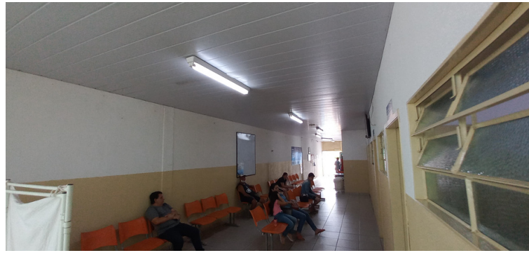
Foto 4 - Unidade carece de readequação no sistema de arrefecimento.