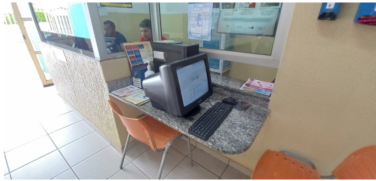
Foto 2 - Equipamentos de informática obsoletos, morosos e em número insuficiente.