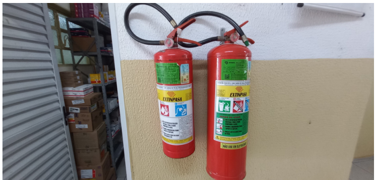
Foto 6 - Extintores da unidade com data expirada.