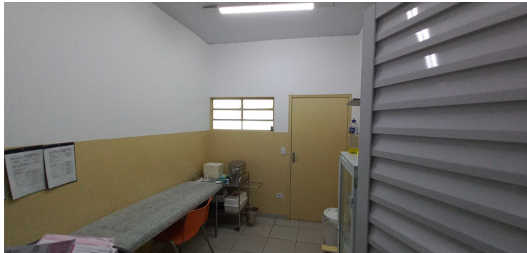
Foto 3 - Sala sem climatização apropriada.