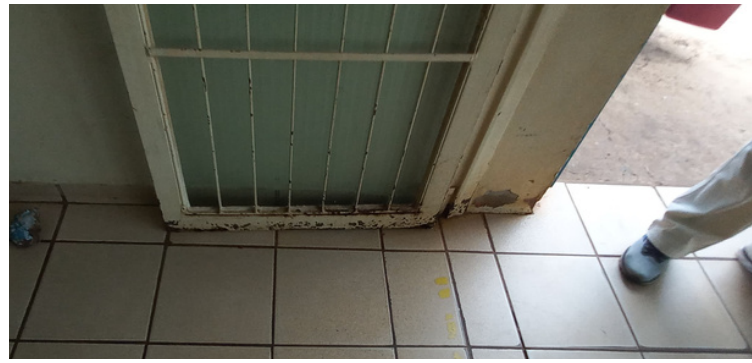
Foto 10 - Portas e esquadrias corroídas pelo mofo.