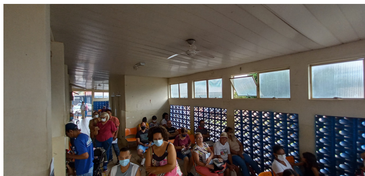
Foto 8 - Sala de espera isenta do adequado acolhimento.