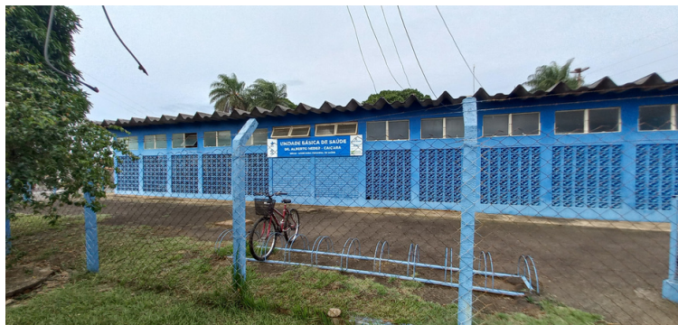
Foto 1 - Fachada da Ubs Dr. Alberto Neder.