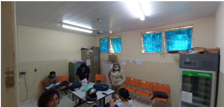
Foto 11 - Sala dos ACS sem a devida climatização e sem o devido suporte.