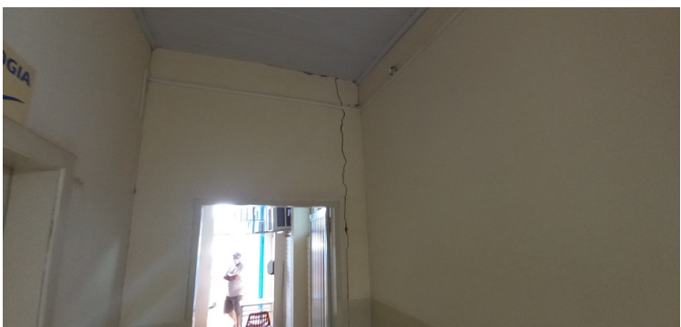
Foto 7 - Rachaduras prejudicando a estrutura da Ubs.