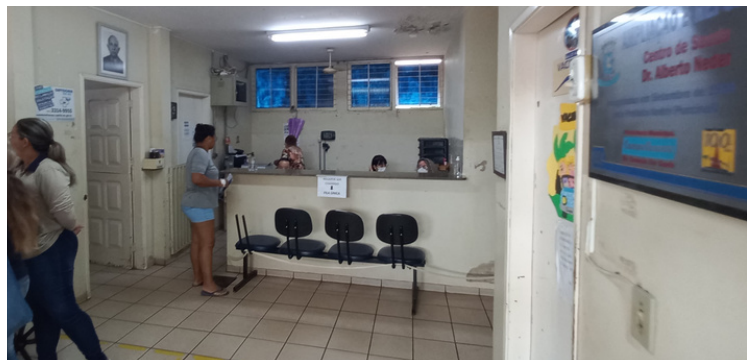
Foto 2 - Recepção desprovida da devida climatização.