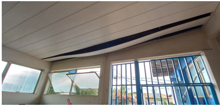
Foto 9 - Forro localizado na sala de espera, encontra-se danificado.