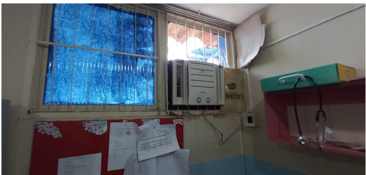
Foto 5 - Janela, na sala de enfermagem, desprovida de vidro, propiciando a passagem de água pluvial.