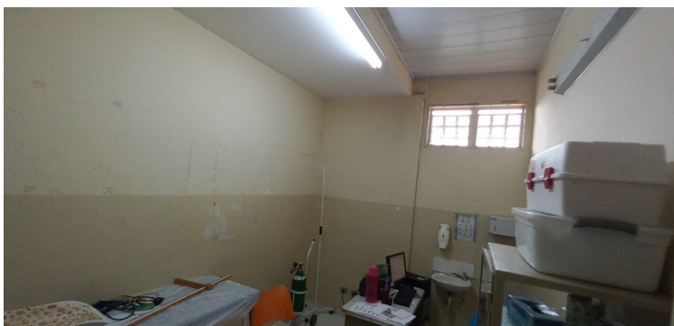
Foto 4 - Determinadas salas e consultórios desprovidos de arrefecimento.