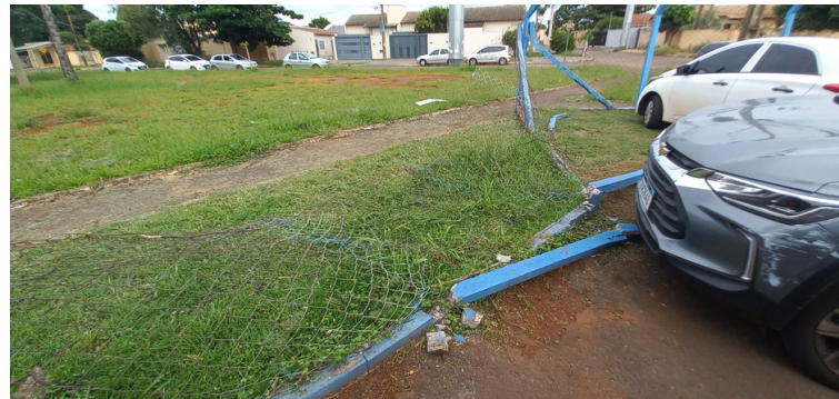
Foto 12 - Parte da grade que circunda a unidade, está danificada.