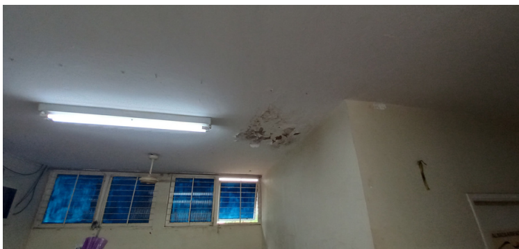
Foto 6 - Infiltrações e proliferação de mofo ocorrendo em locais pontuais da unidade.