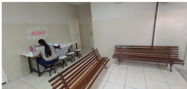
Foto 8 - Local que são realizadas as reuniões de equipe, isento de privacidade.