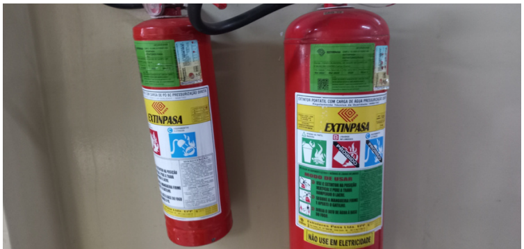
Foto 6 - Extintores da unidade com data expirada.