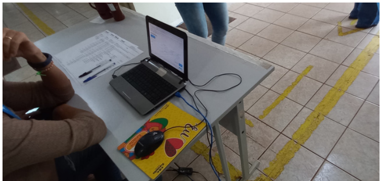
Foto 5 - Equipamentos de informática obsoletos, morosos e em número insuficiente.