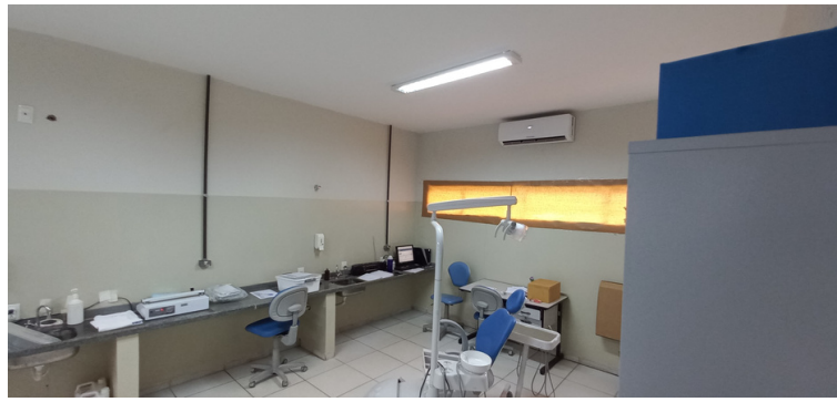
Foto 10 - Setor de Odontologia com seladora instalada em local indevido.