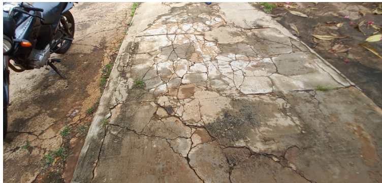
Foto 11 - Pavimento de acesso à unidade com desníveis.