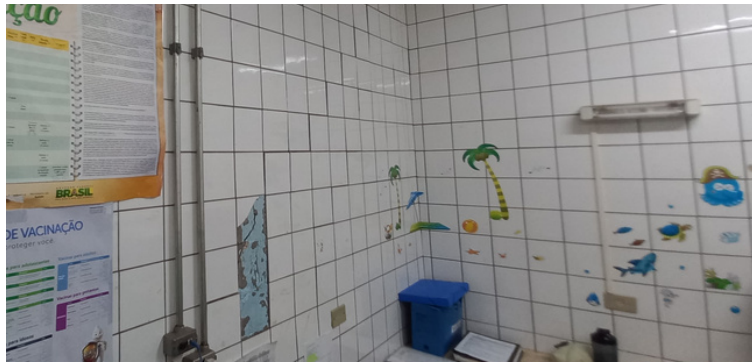
Foto 3 - Salas com azulejos caídos.