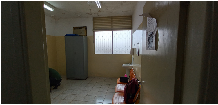
Foto 9 - Sala dos ACS com apenas um equipamento de informática e sem climatização.