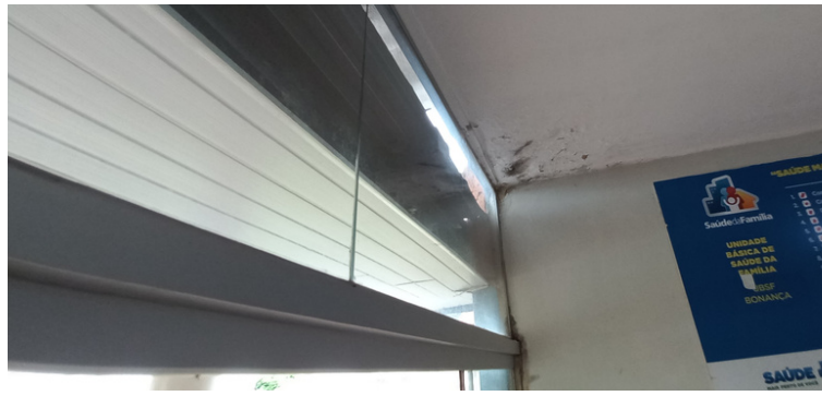
Foto 4 - Salas com bolor aparente.