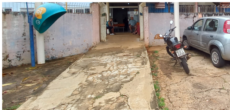
Foto 12 - Unidade sem acessibilidade adequada.