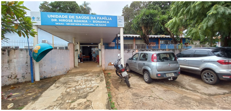
Foto 1 - Fachada da USF Dr. Hirose Adania, Bonança.