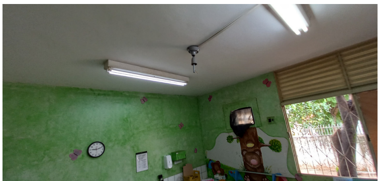
Foto 7 - Salas sem a devida climatização.