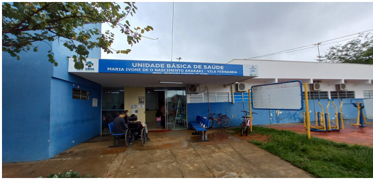
Foto 1 - Fachada da USF Maria Ivone de Oliveira Nascimento Arakaki, Vila Fernanda.