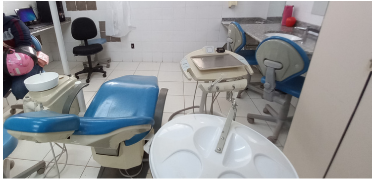
Foto 3 - Cadeira do setor de Odontologia aguardando reparo.