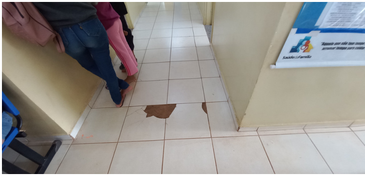
Foto 9 - Assoalho com azulejos quebrados.