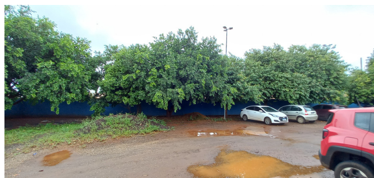
Foto 8 - Estacionamento com iluminação parcial, pois os fios de energia elétrica foram furtados.