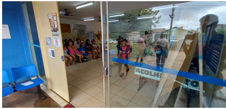
Foto 10 - Porta de acesso principal da unidade aguardando reparo definitivo.