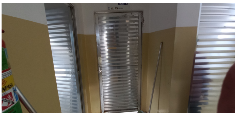
Foto 7 - Porta de acesso a unidade estragada, aguardando conserto.