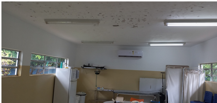
Foto 5 - Auditório com pontos de infiltração e bolor evidente.