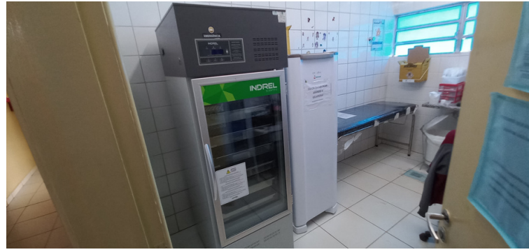
Foto 4 - Câmara fria da sala de vacinas avariada.