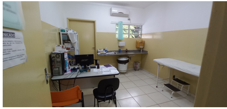
Foto 2 - Equipamentos de informática obsoletos, morosos e em número insuficiente.