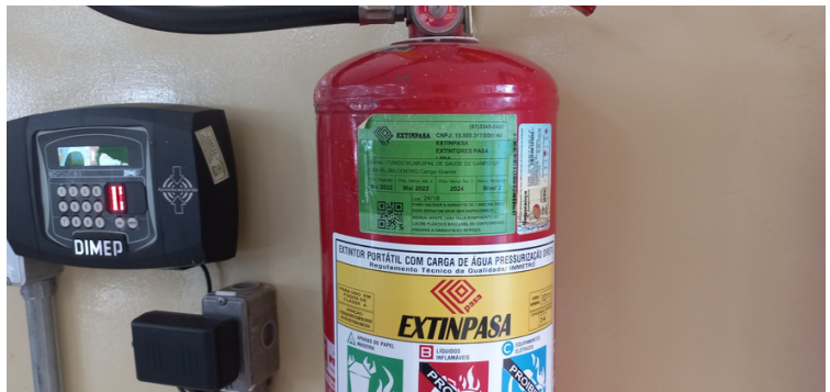
Foto 6 - Extintores da unidade com data expirada.