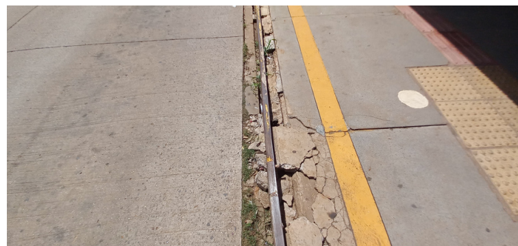
Foto 6 - Plataforma de embarque e desembarque de passageiros, danificada em determinados locais.