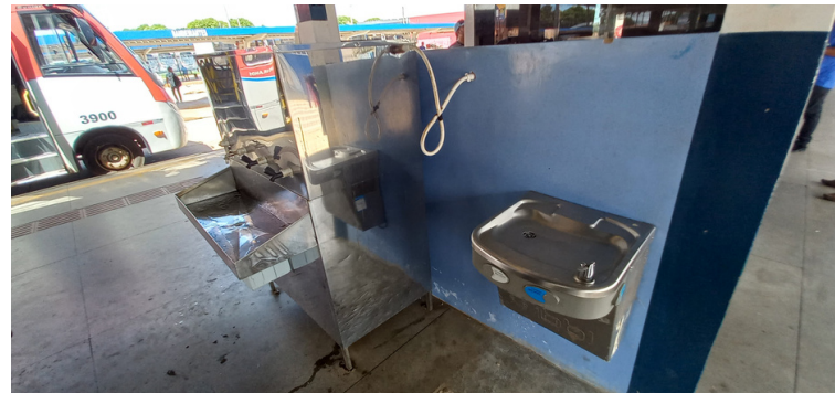
Foto 4 - Bebedouros avariados.