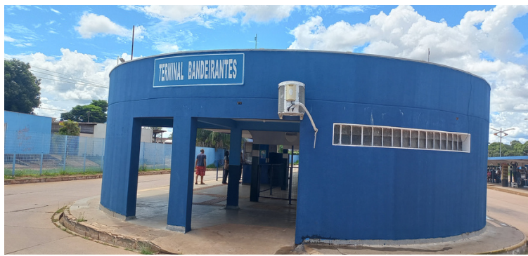
Foto 1 - Fachada do Terminal Bandeirantes