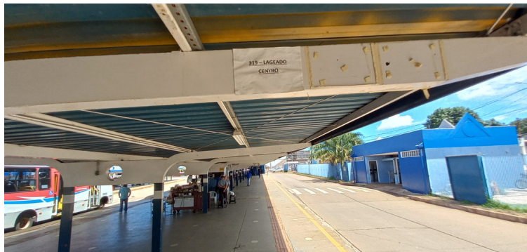
Foto 5 - Sinalização inadequada das linhas de ônibus.