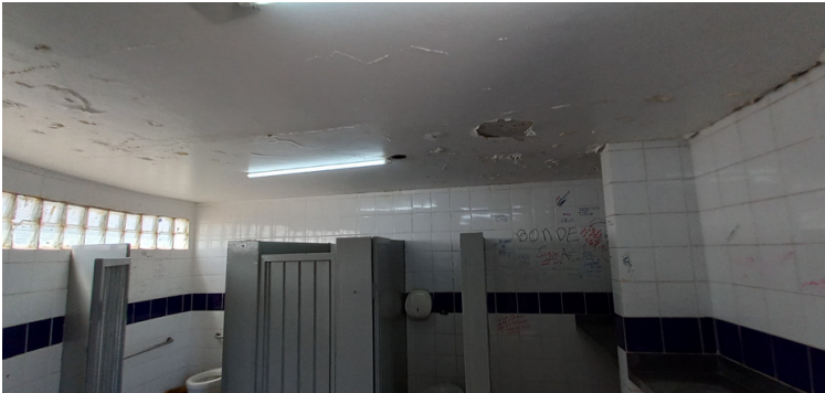
Foto 3 - Banheiros com infiltrações, desestruturados, vandalizados e com extensos vazamentos hidráulicos.