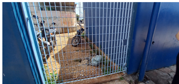
Foto 8 - Duto de drenagem obstruído, propiciando acúmulo de água e conseqüente criadouro de mosquitos.