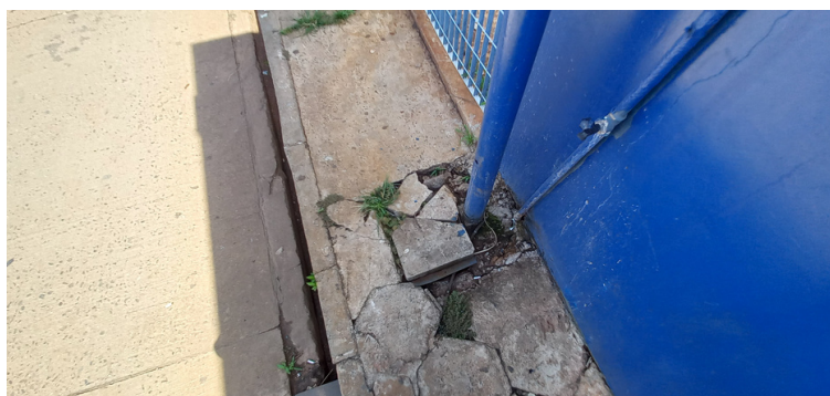
Foto 7 - Caixas de passagem de fiação elétrica encontram-se danificadas.