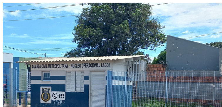
Foto 2 - Guarda Civil resguarda cidadãos e o patrimônio.