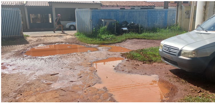
Foto 9 - Calçada de acesso à unidade com pavimento deteriorado e acúmulo de água .