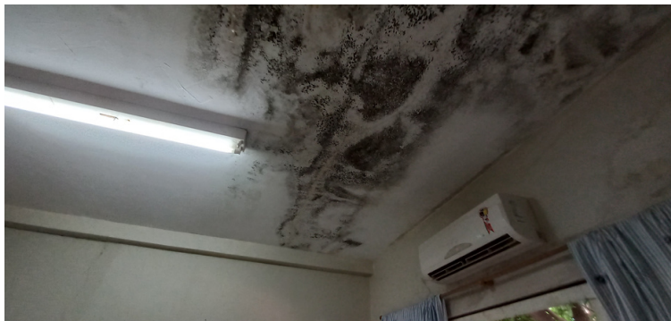
Foto 5 - Locais da unidade com pontos de infiltração e bolor evidente.