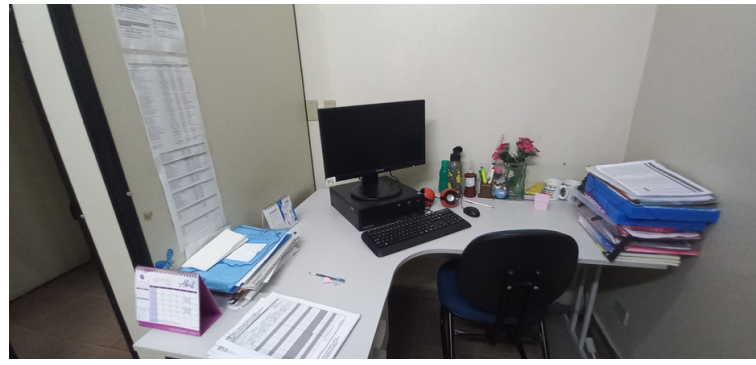
Foto 2 - Equipamentos de informática obsoletos, morosos e em número insuficiente.