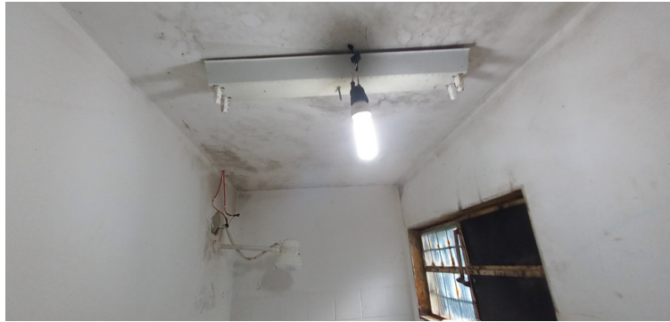
Foto 3 - Fiação elétrica exposta.