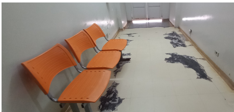
Foto 7 - Piso da unidade extremamente deteriorado.