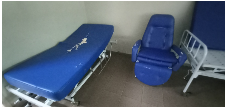
Foto 10 - Mobiliário avariado, aguardando reparo.