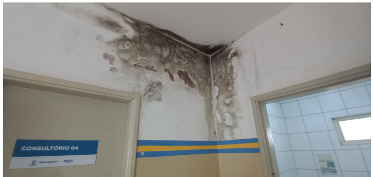
Foto 6 - Vários pontos de infiltração e mofo evidente.