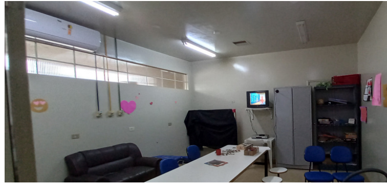
Foto 4 - Luminárias com lâmpadas queimadas.