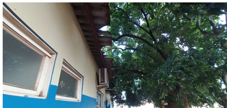
Foto 8 - Árvores que necessitam de poda, pois danificam o telhado.