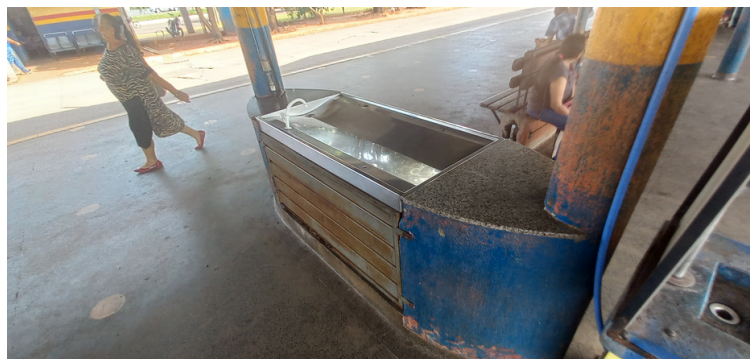
Foto 6 - Bebedouro avariado, incapaz de ofertar água resfriada.