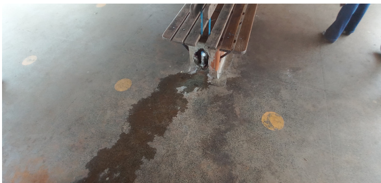
Foto 9 - Torneira isenta da devida proteção, utilizada indevidamente por usuários.