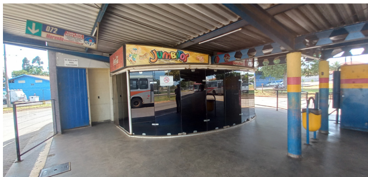
Foto 10 - Espaço físico sem utilização.