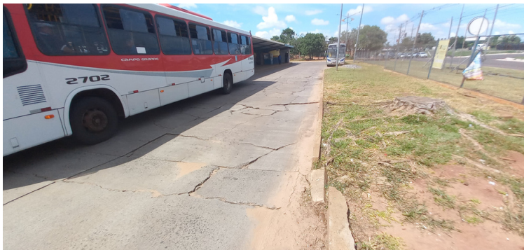
Foto 11 - Pavimento onde trafegam os ônibus com extensas rachaduras.