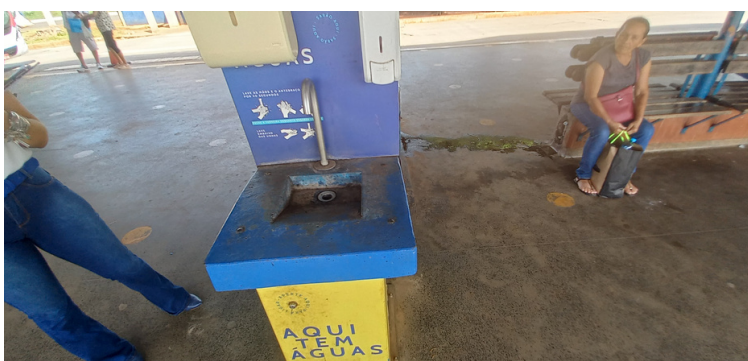
Foto 7 - Lavatório danificado, sem funcionalidade.