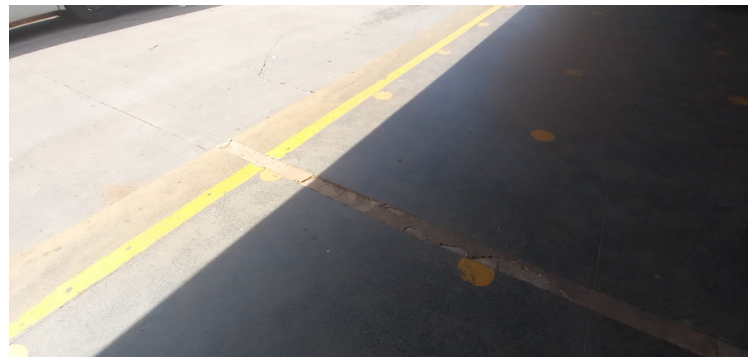
Foto 12 - Plataforma de embarque e desembarque de passageiros, danificada em determinados locais.