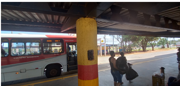
Foto 8 - Fiação elétrica exposta, oportunizando furtos e avarias.