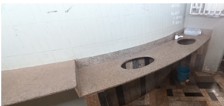
Foto 4 - Sanitários desprovidos de torneiras e pias.