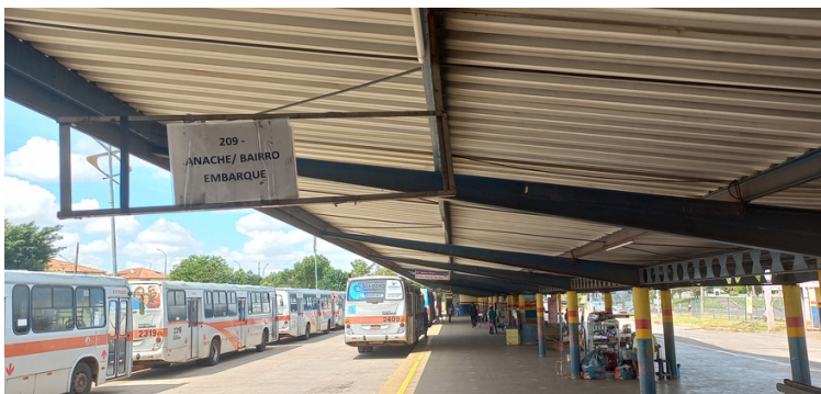
Foto 5 - Sinalização inadequada das linhas de ônibus.