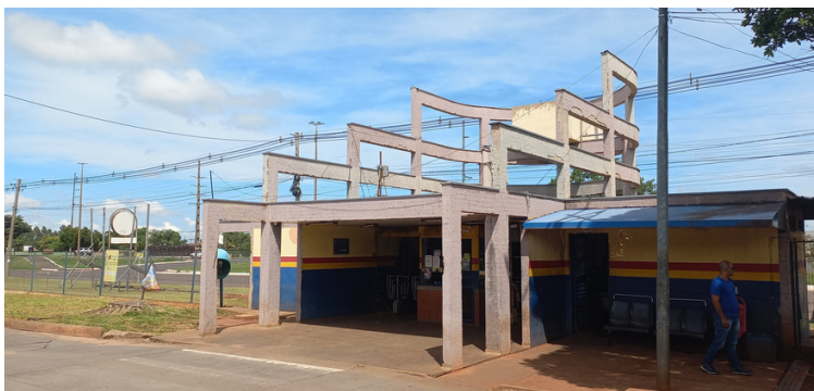
Foto 1 - Fachada do Terminal Nova Bahia desprovido de revestimento.