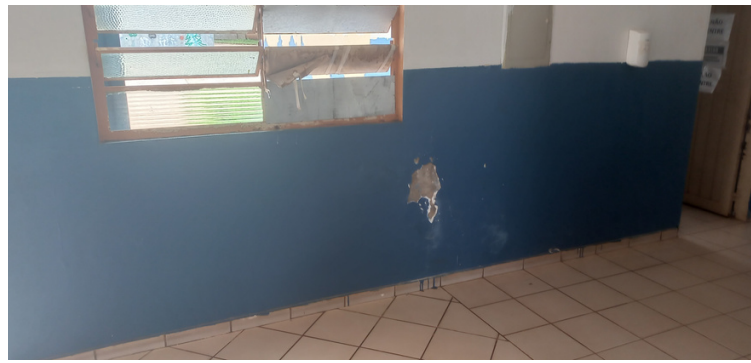
Foto 2 - Vidros quebrados aguardando a substituição.