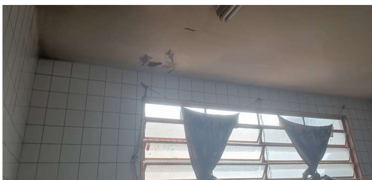
Foto 4 - Pintura desgastada carecendo revitalização.