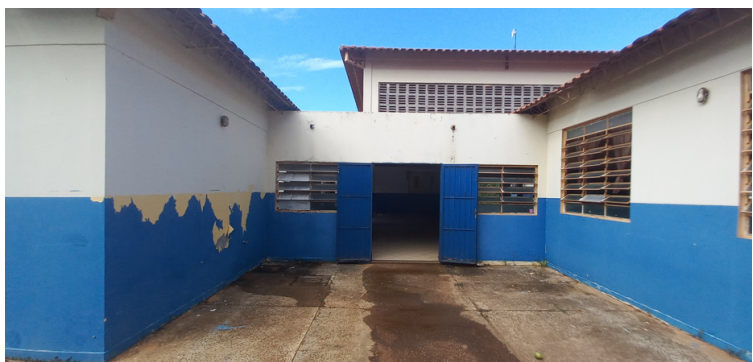
Foto 7 - Pintura externa desgastada.