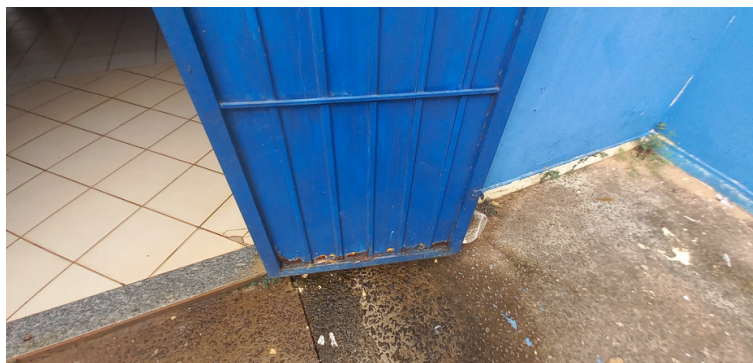
Foto 3 - Esquadrias enferrujadas.