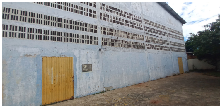
Foto 8 - Quadra de esportes interdita devido a infestação de pombos.