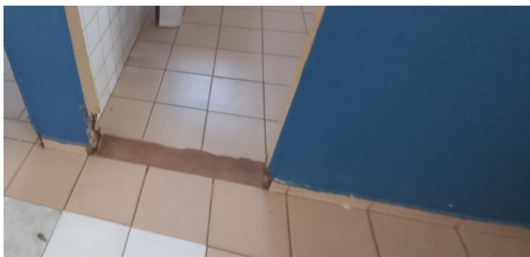
Foto 6 - Banheiro sem porta.