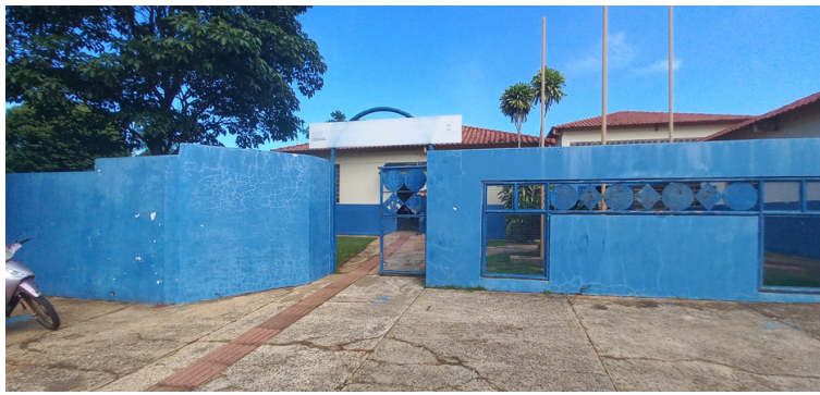
Foto 1 - Fachada do CRAS Margarida Simões Corrêa Neder, Estrela Dalva.