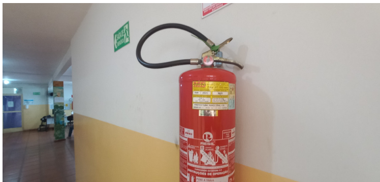
Foto 12 - Extintores com a data de validade vencida.