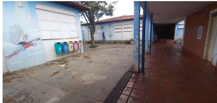
Foto 4 - Pintura, por toda a extensão da repartição, necessitando revitalização.