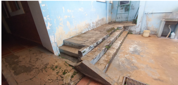
Foto 3 - Rampa de acessibilidade localizada no interior do centro, avariada, causando desnivelamento.