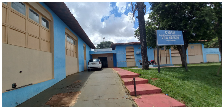
Foto 1 - Fachada do CRAS Vila Nasser.