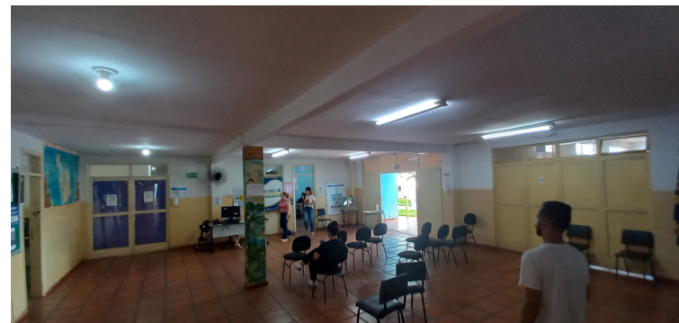
Foto 6 - Recepção sem a devida climatização.