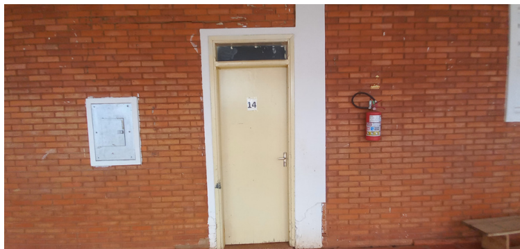
Foto 5 - Sala interditada devido às extensas rachaduras prejudicando sua estrutura.