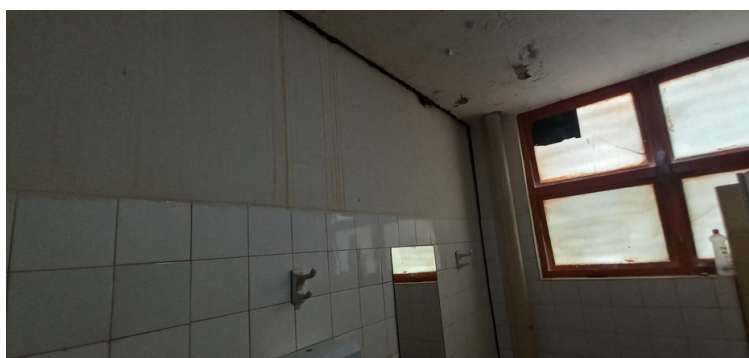
Foto 7 - Banheiro com a estrutura comprometida em função de rachaduras, infiltração e mofo.