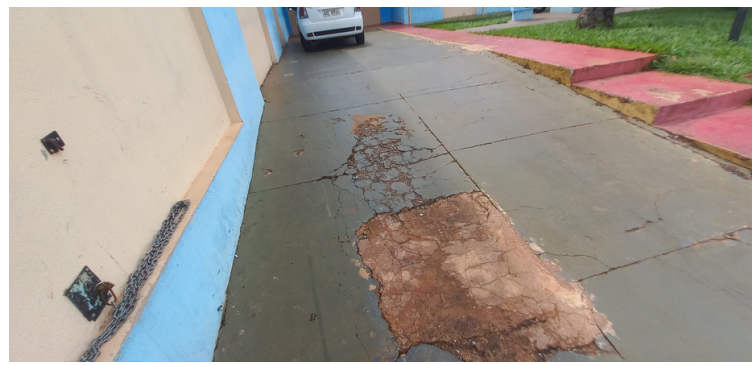
Foto 2 - Rampa de acesso na entrada da unidade, com irregularidades em sua superfície