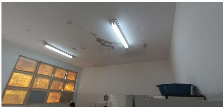
Foto 10 - Infiltrações e proliferação de mofo ocorrem na cozinha.