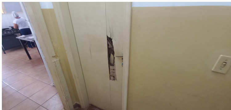
Foto 11 - Portas desgastadas e deterioradas.