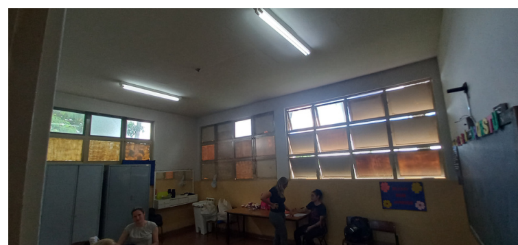
Foto 8 - Climatização insatisfatória ou inexistente, na maioria das salas do CRAS.