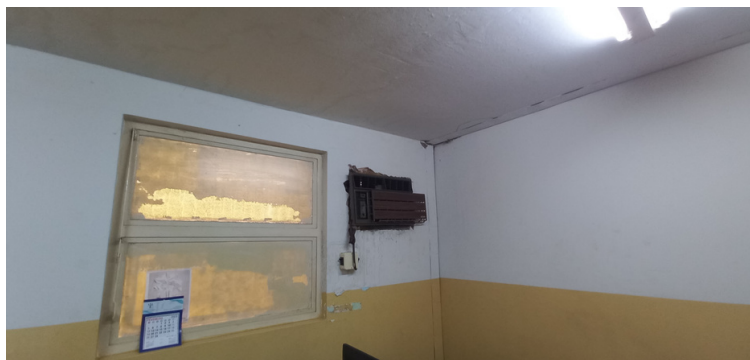
Foto 9 - Equipamento de ar condicionado obsoleto e ineficiente.