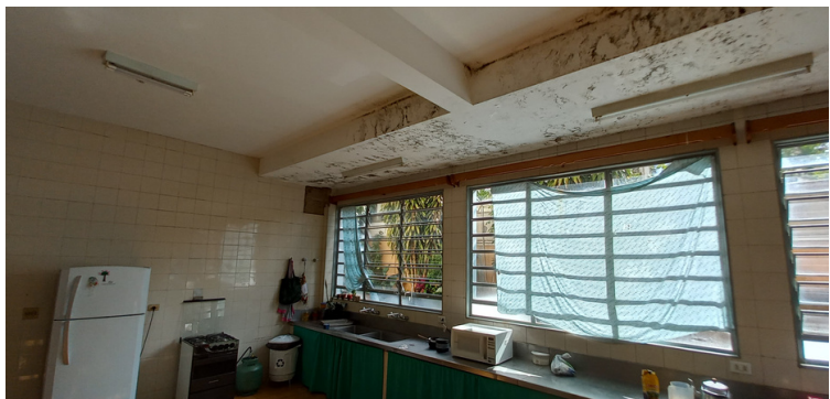
Foto 5 - Cozinha com pontos de bolor evidente.