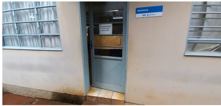
Foto 2 - Vidros quebrados aguardando substituição.