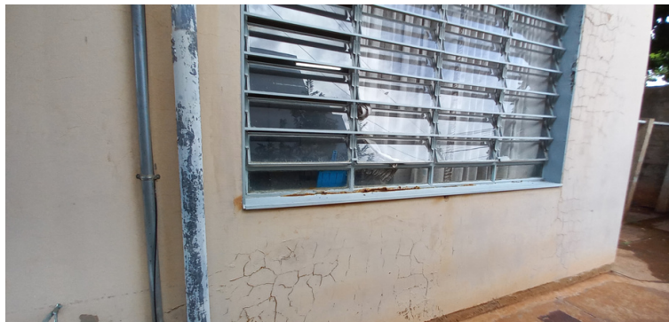
Foto 3 - Janelas enferrujadas.