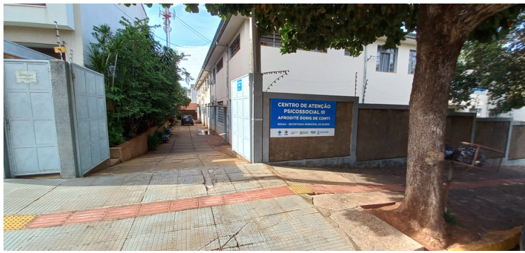
Foto 1 - Fachada do CAPS III - Afrodite Dóris de Conti, Monte Castelo.