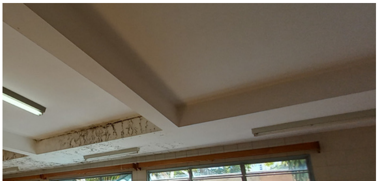
Foto 6 - Lâmpadas queimadas que necessitam de substituição.