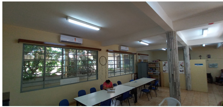
Foto 4 - Sala de convivência bem equipada e climatizada.