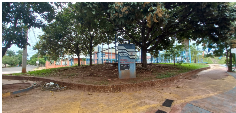
Foto 1 - Monumento da Praça das Araras.