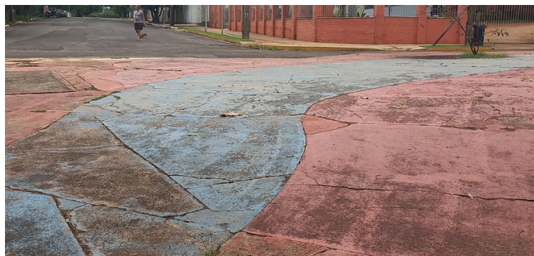
Foto 2 - Calçamento interno da praça com rachaduras.