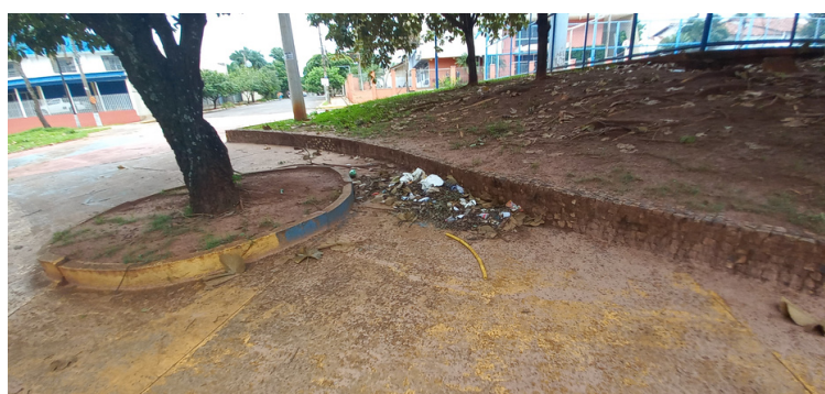
Foto 8 - Descarte irregular de lixo, em locais pontuais do espaço público.