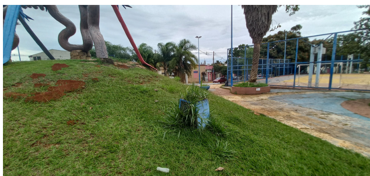
Foto 7 - Luminárias repletas de vegetação, incapazes de oferecer satisfatória iluminação.