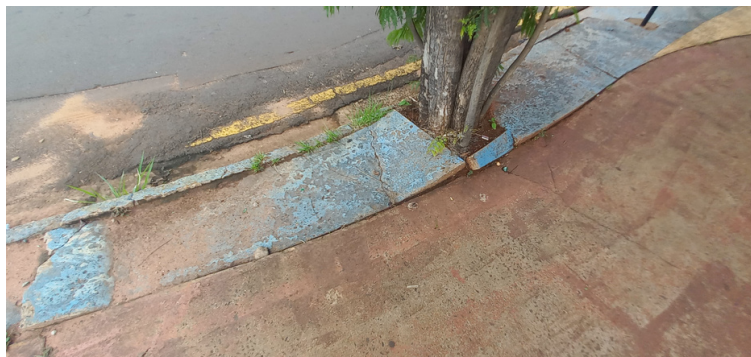
Foto 3 - Raízes de árvores prejudicando a estrutura da calçada.