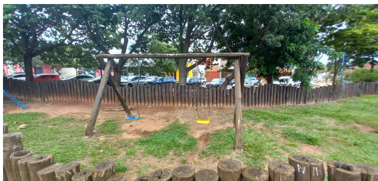
Foto 5 - Parquinho com poucos brinquedos e, alguns deles, avariados.