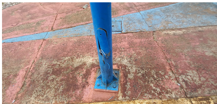
Foto 6 - Postes de iluminação com a fiação danificada.