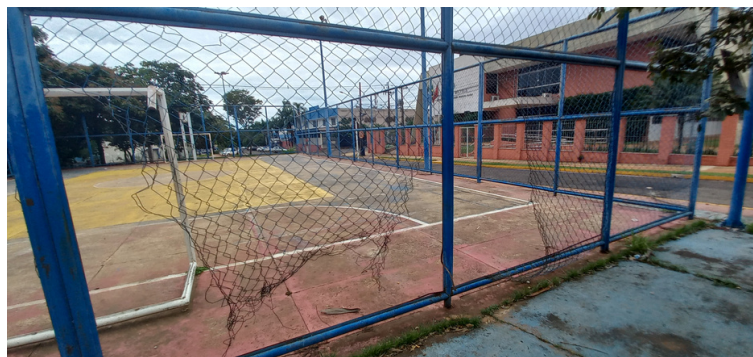
Foto 4 - Quadra esportiva na precisão de reforma e revitalização da pintura.