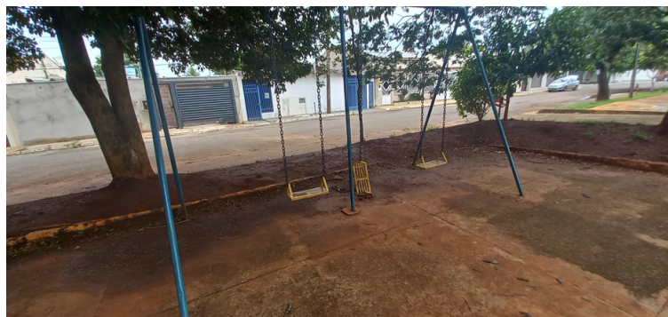
Foto 4 - Balanço avariado.