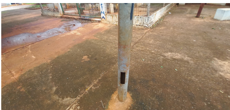
Foto 7 - Postes de luz isentos de fiação elétrica.