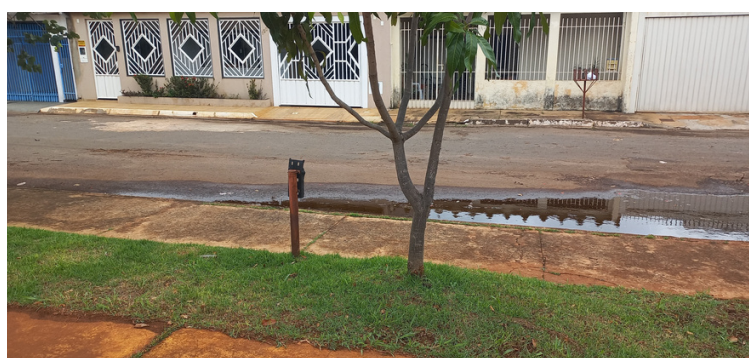
Foto 8 - Lixeiras inexistentes no espaço público.