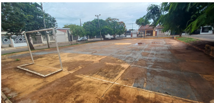
Foto 5 - Quadra esportiva com a pintura desgastada e piso danificado.