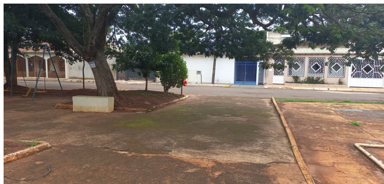
Foto 2 - Calçamento da praça com rachaduras.