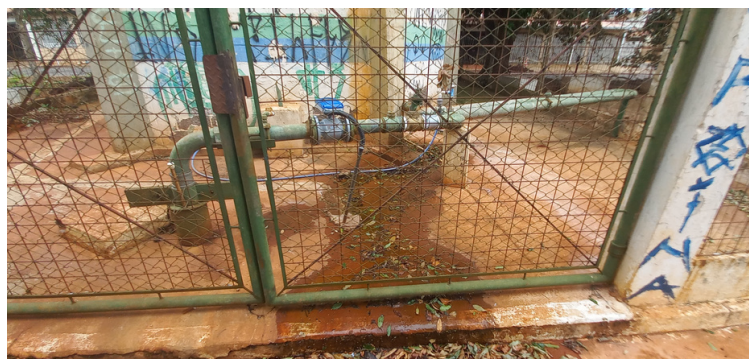
Foto 6 - Caixa d'água com a estrutura danificada e vazamento de água.