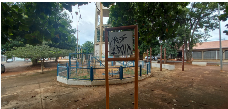
Foto 1 - Placa de identificação da praça depredada.