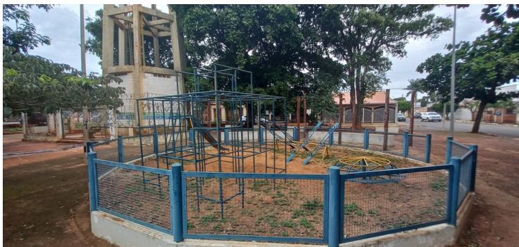
Foto 3 - Parquinho estruturado, entretanto com acesso livre a animais.