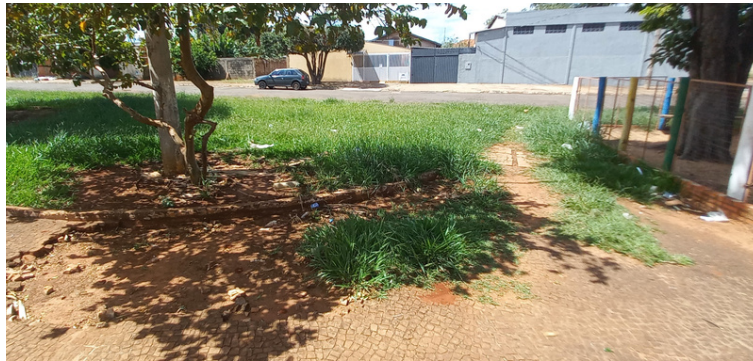
Foto 3 - Mato alto por todo o espaço.