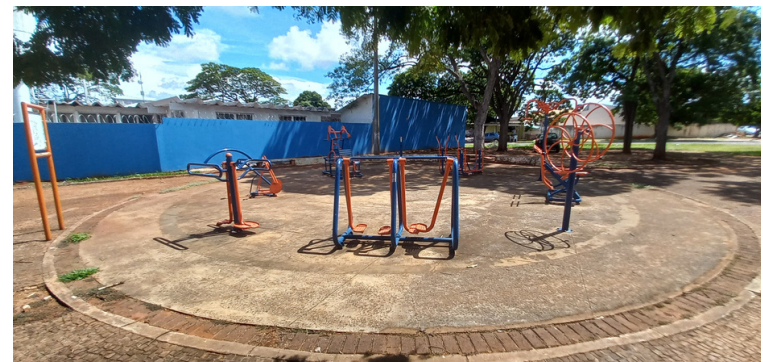
Foto 6 - Academia ao ar livre com determinados aparelhos avariados.