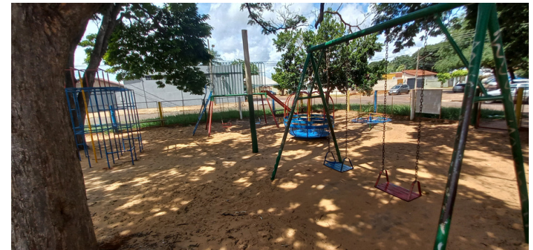
Foto 8 - Parque infantil bem conservado.