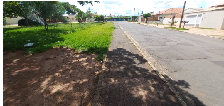
Foto 4 - Pista com desníveis e pavimento desgastado.