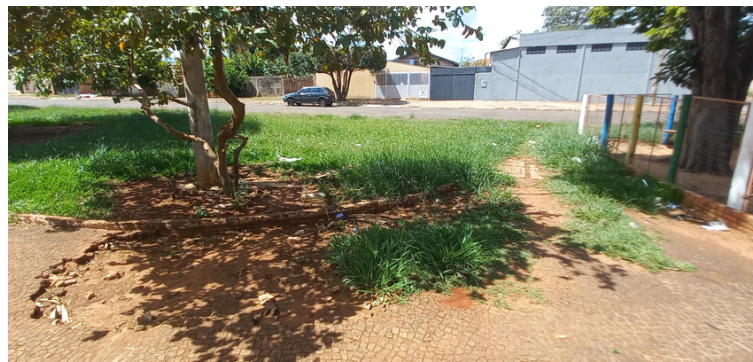
Foto 5 - Calçada desnivelada em vários pontos.