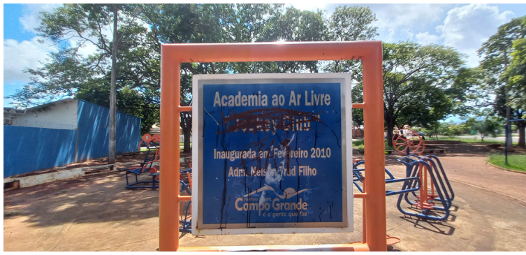
Foto 1 - Monumento da Praça Jockey Club.