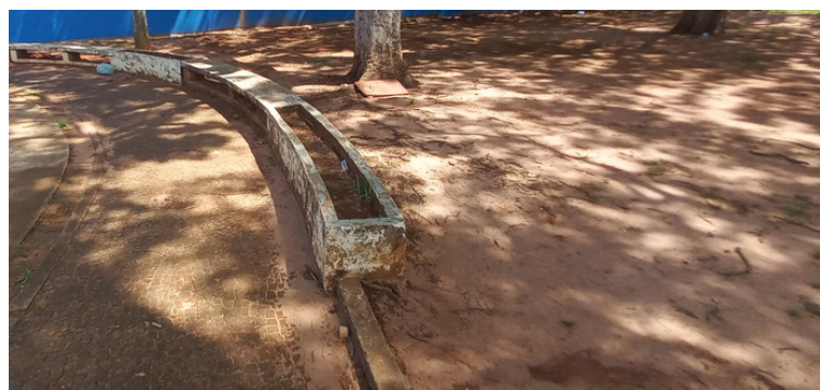
Foto 7 - Bancos de descanso danificados.