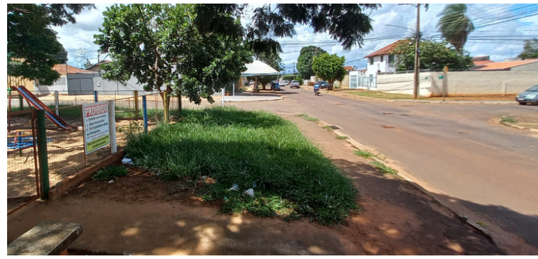
Foto 2 - Lixo espalhado por toda a praça.