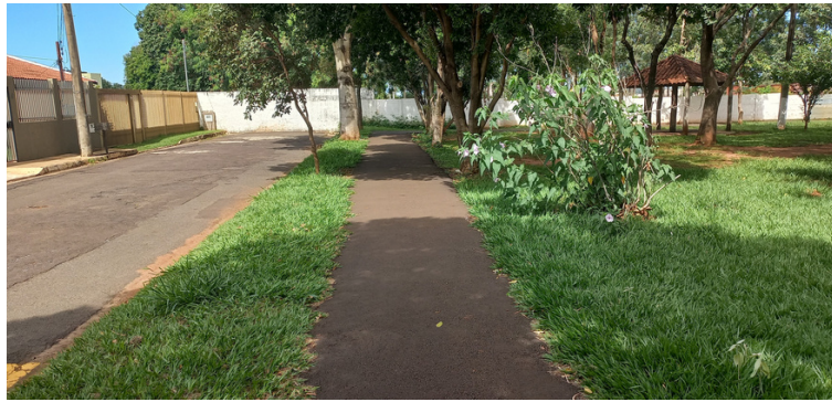
Foto 3 - Pista de caminhada bem conservada.