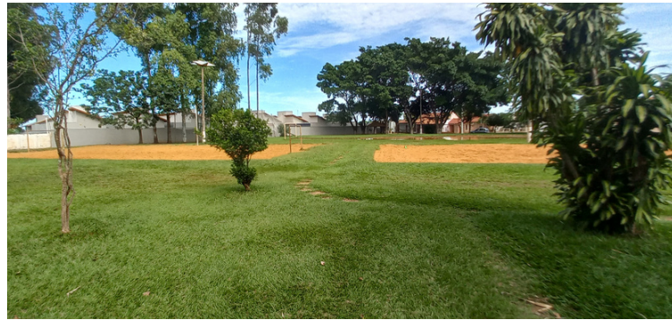
Foto 5 - Mudanças de árvores plantadas recentemente.