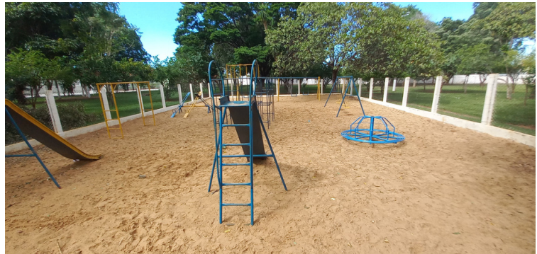
Foto 6 - Parque infantil bem conservado.