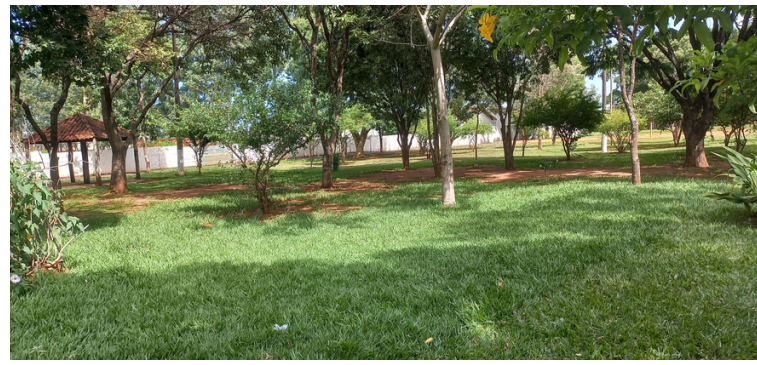
Foto 2 - Praça bastante arborizada e bem preservada.