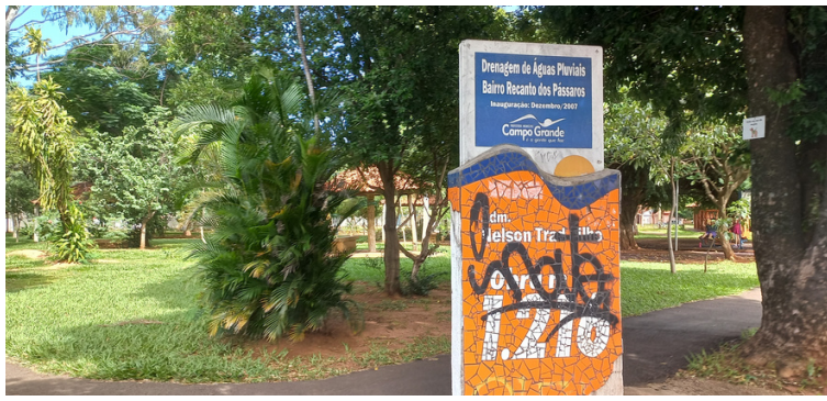
Foto 1 - Monumento da Praça Recanto dos Pássaros.