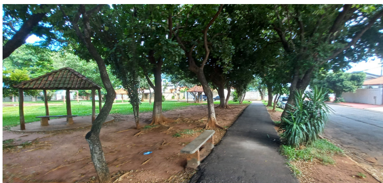
Foto 7 - Quiosques cobertos e com bancos.