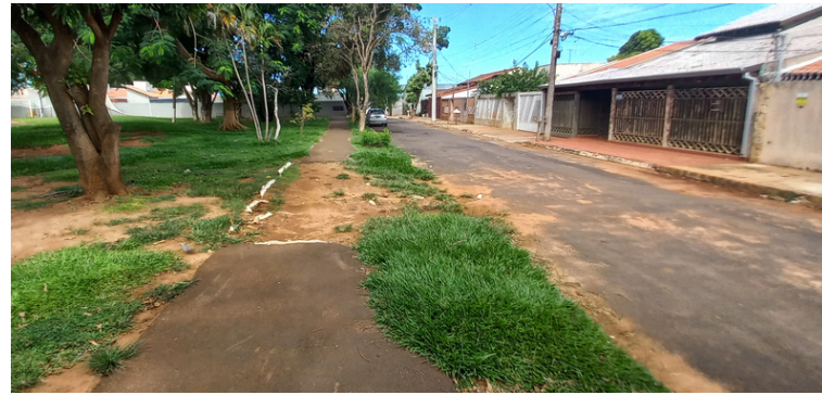
Foto 4 - Determinado ponto da pista de caminhada deteriorado.