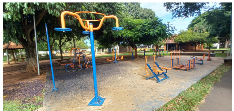
Foto 8 - Academia ao ar livre recentemente inaugurada.