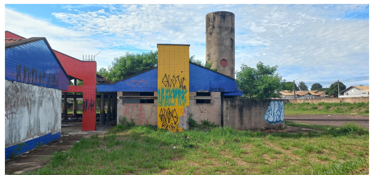
Foto 8 - A construção sofreu furtos de materiais e atos de vandalismo.