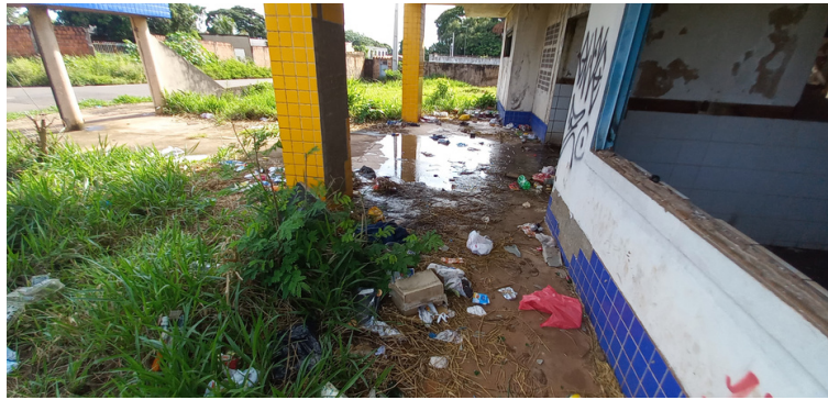
Foto 3 - Acúmulo de água por toda a edificação.