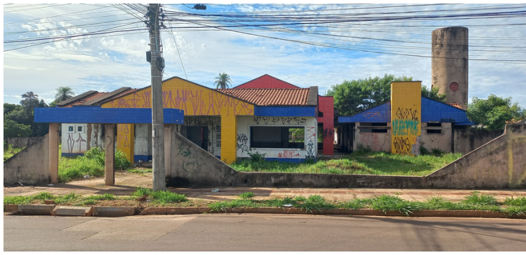
Foto 1 - Fachada da obra inacabada da EMEI Jardim Anache, Jardim Anache.