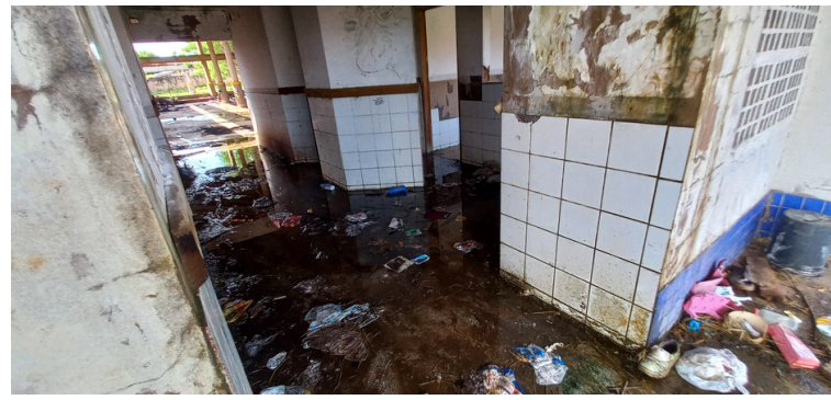
Foto 2 - Lixo acumulado por toda a extensão da construção.