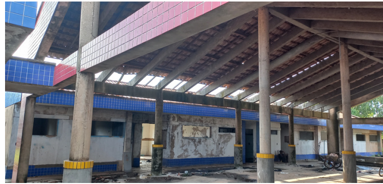
Foto 4 - Telhas quebradas e furtadas.