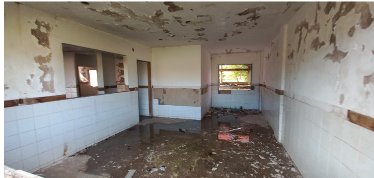
Foto 5 - Pintura bastante desgastada.