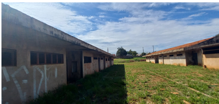
Foto 7 - Obra depreciada pela ação do tempo e pelas intempéries.