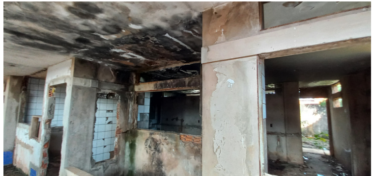
Foto 6 - Infiltrações por toda área e bolor evidente.