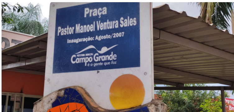
Foto 1 - Monumento da Praça Pastor Manoel Ventura Sales, Moreninha III.