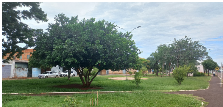
Foto 2 - Praça bem arborizada e com espaço amplo.