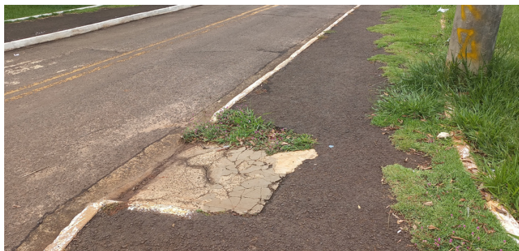
Foto 4 - Pista de caminhada com pontos com desníveis .