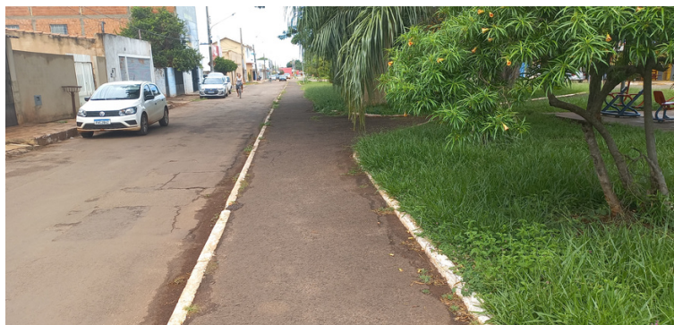
Foto 3 - Local com mato alto.