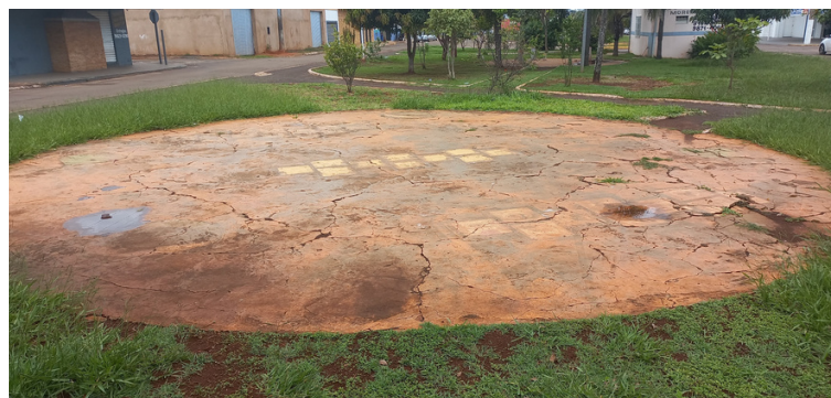
Foto 5 - Espaços para recreação infantil com pavimento desgastado.