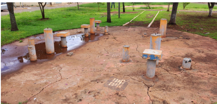
Foto 6 - Áreas de convivência com mesas e bancos de descanso depredados.