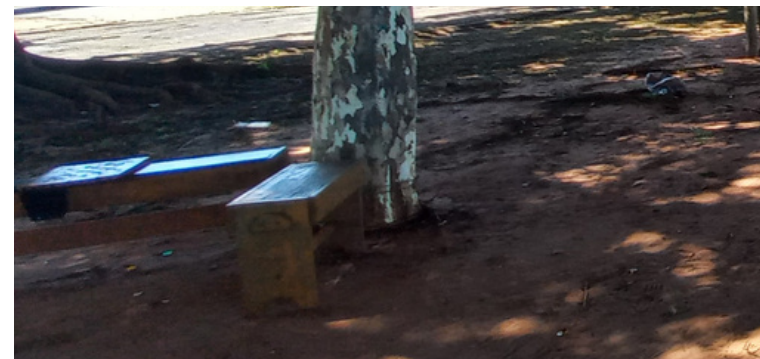
Foto 6 - Bancos e jogos de tabuleiros instalados pela população.