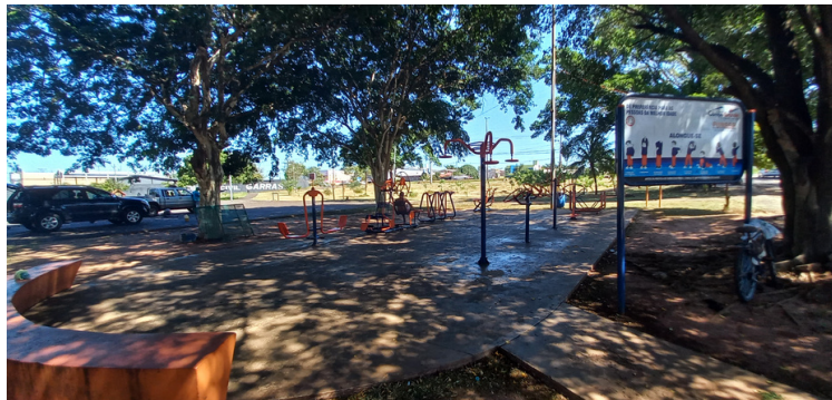
Foto 5 - Academia ao ar livre disponível para a população.