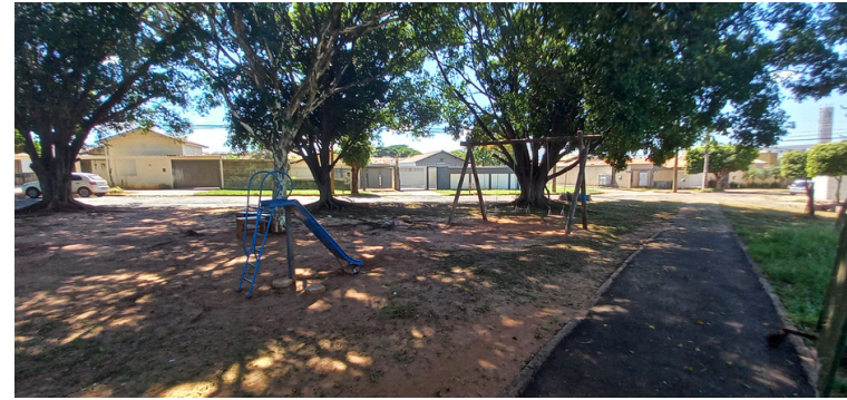
Foto 4 - Parquinho infantil necessitando de melhorias.