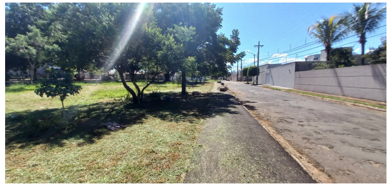
Foto 2 - Área verde satisfatoriamente mantida.