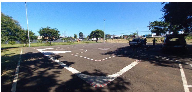
Foto 7 - Heliponto instalado na praça, também utilizado para realização de eventos e esportes