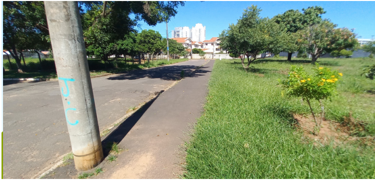
Foto 3 - Pista de caminhada adequada para uso dos munícipes.