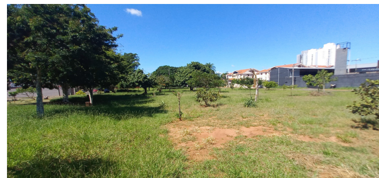
Foto 8 - Praça escassa de atrativos para lazer e socialização.