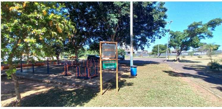
Foto 1 - Praça Flamboyant