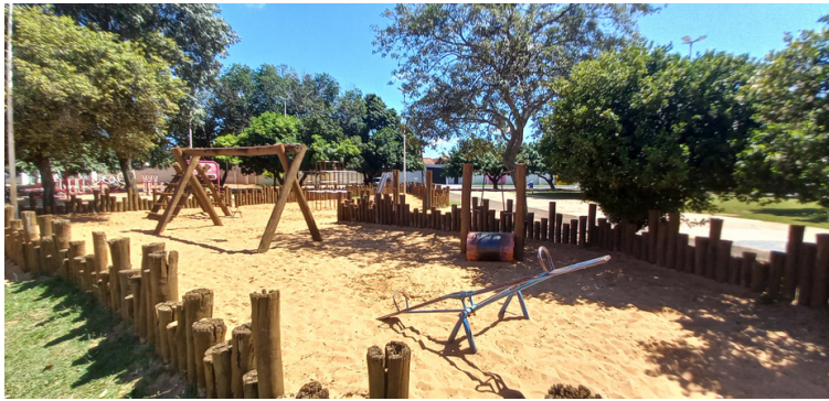
Foto 3 - Parque infantil com determinados brinquedos danificados e sem portão.