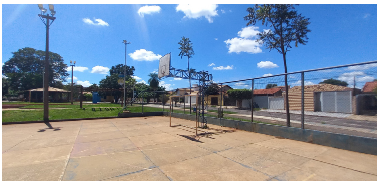
Foto 7 - Quadra de esportes com pintura desgastada e faltando cesta de basquetebol.