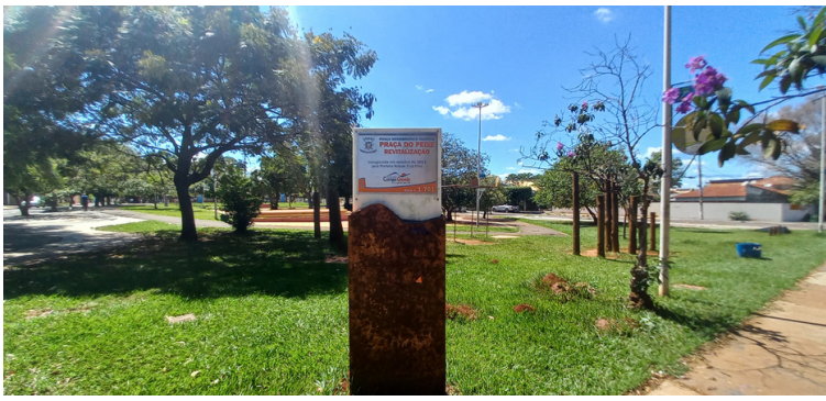
Foto 1 - Monumento da Praça Demosthenes Martins, Vilas Boas.