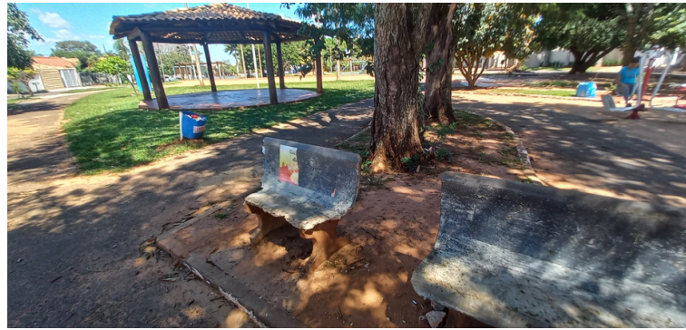
Foto 4 - Bancos para descanso com avaria.