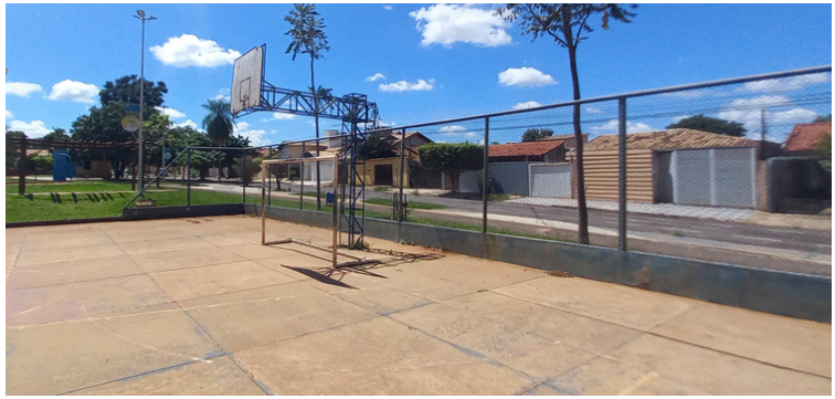
Foto 6 - Quadra poliesportiva com tela de proteção deteriorada.