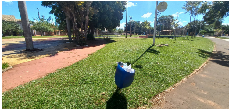
Foto 5 - Lixeiras com lixo acumulado.