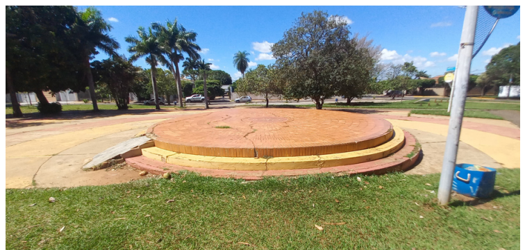
Foto 8 - Palco para apresentações artísticas com piso desgastado e com rachaduras.