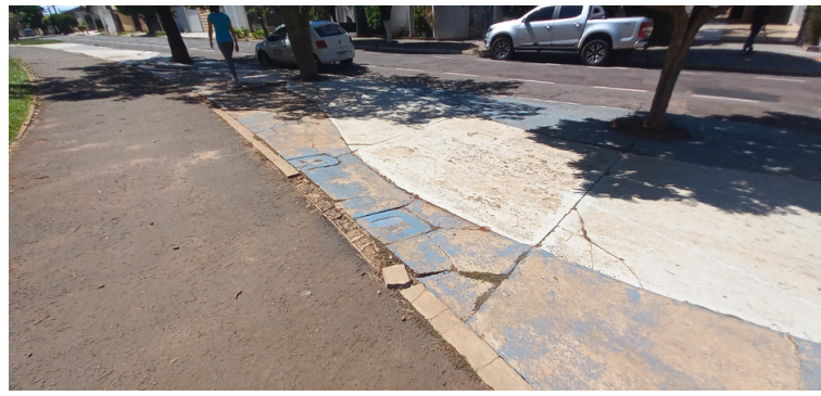
Foto 2 - Pista de caminhada com desniveis no pavimento.