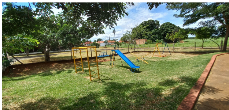
Foto 6 - Parquinho infantil devidamente conservado e mantido.