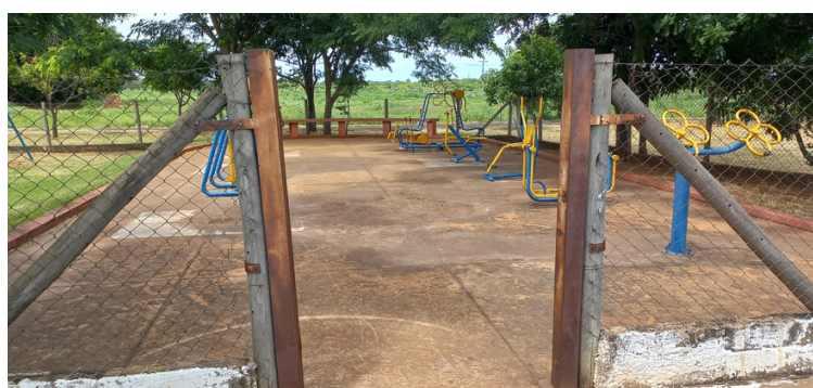
Foto 8 - Portão inexistente na área recreativa.