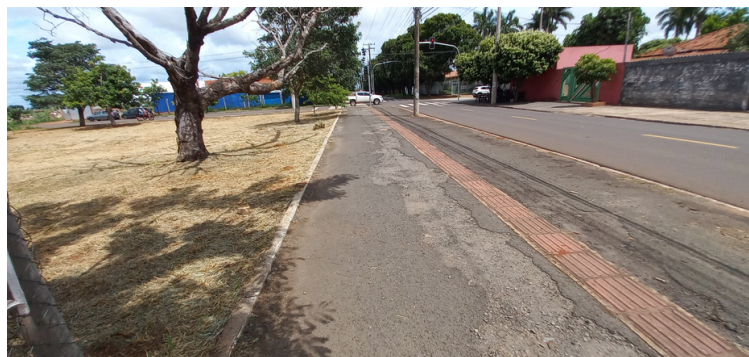
Foto 4 - Pista de caminhada deteriorada.