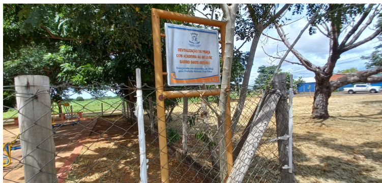
Foto 1 - Placa de identificação da Praça Santo Antônio.