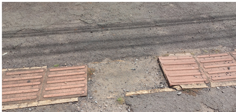
Foto 3 - Piso táctil danificado.