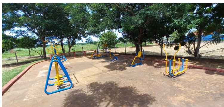
Foto 7 - Academia ao ar livre satisfatoriamente conservada.