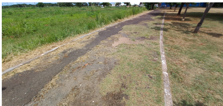
Foto 5 - Vegetação alastrando-se pela pista de caminhada.