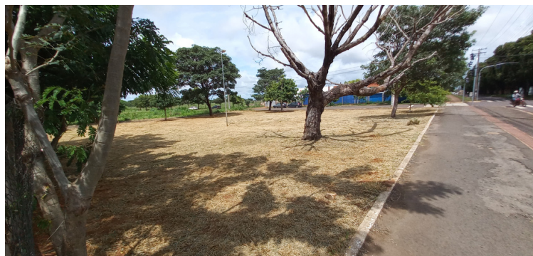
Foto 2 - Área verde devidamente conservada.