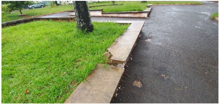
Foto 6 - Determinados bancos de descanso com avarias.