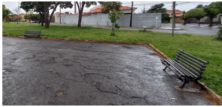
Foto 2 - Praça arborizada e bem conservada.