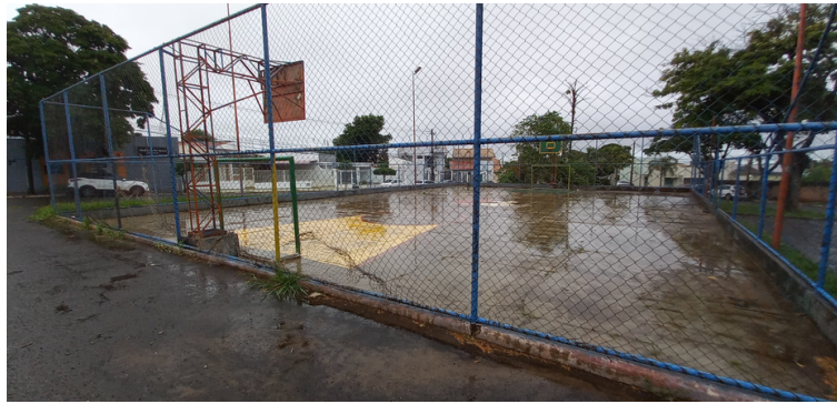
Foto 3 - Quadra para a prática de esportes com grade de proteção bastante danificada.