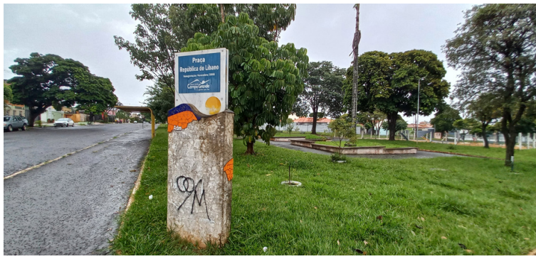
Foto 1 - Monumento da Praça República do Líbano, Jardim São Bento.