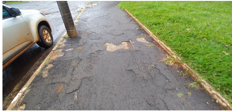
Foto 5 - Pista com pavimento com desníveis e necessitando de recapeamento.