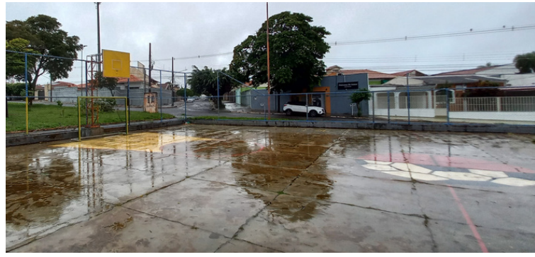
Foto 4 - Quadra de esportes com a falta da cesta de basquetebol.