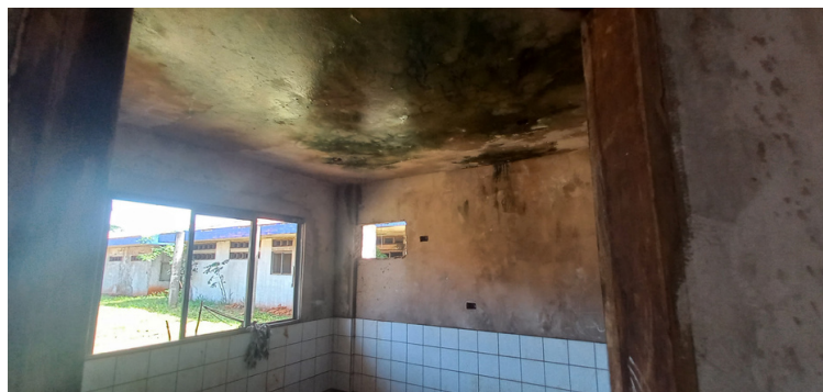
Foto 4 - Infiltrações e mofo comprometendo a edificação.