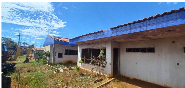
Foto 5 - Esquadrias oxidadas.