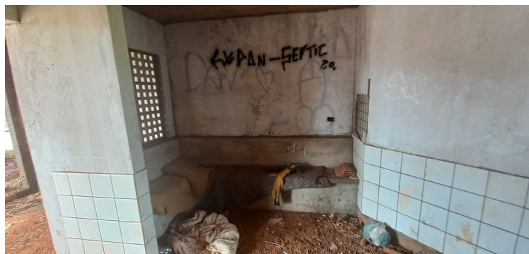
Foto 2 - Construção sendo refúgio para pessoas em situação de rua e usuários de drogas.