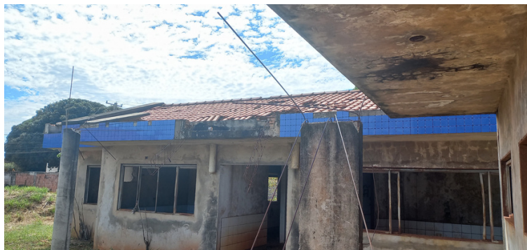
Foto 3 - Telhas danificadas.