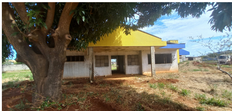
Foto 1 - Edificação da EMEI Jardim Oliveira III.