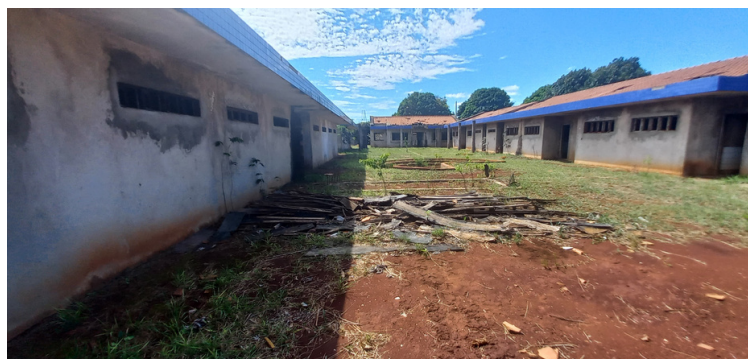
Foto 6 - Entulhos descartados no local.