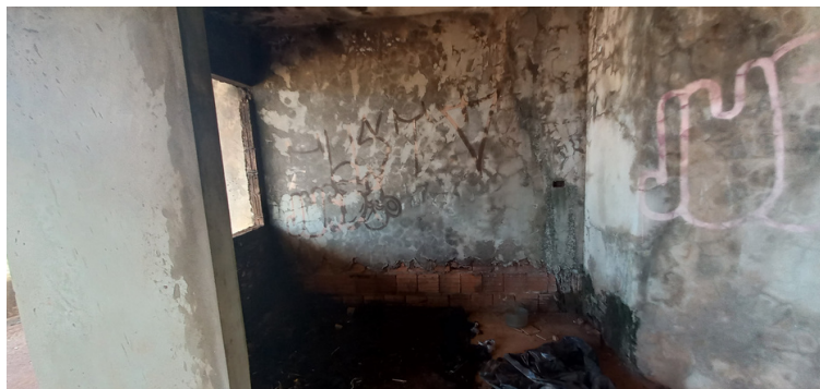
Foto 3 - Infiltrações e mofo comprometendo a edificação.