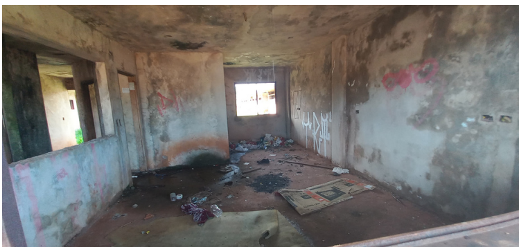
Foto 4 - Construção sendo refúgio para pessoas em situação de rua, criminosos e usuários de drogas.