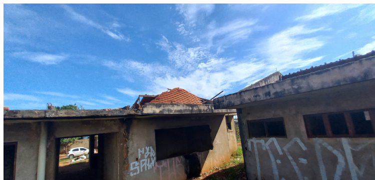
Foto 2 - Telhas avariadas e constantes objetos de furtos.