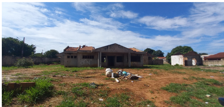
Foto 1 - Edificação da EMEI Jardim Talismã.