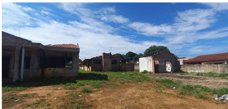
Foto 5 - Edificação apresentando falhas estruturais e segue deteriorando.