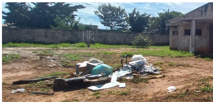
Foto 6 - Descarte de lixo e entulho ocorrem no local.