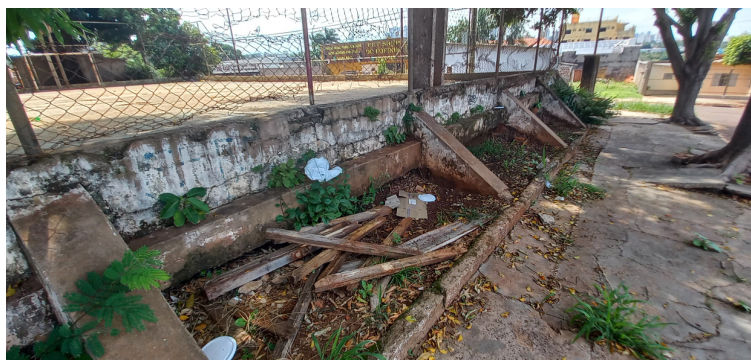
Foto 7 - Descarte irregular de lixo, em locais pontuais do espaço público.