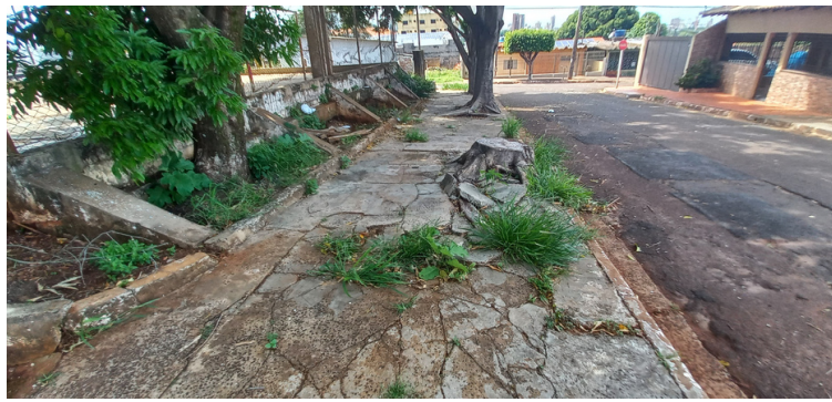
Foto 1 - Calçada danificada por toda a extensão da praça.