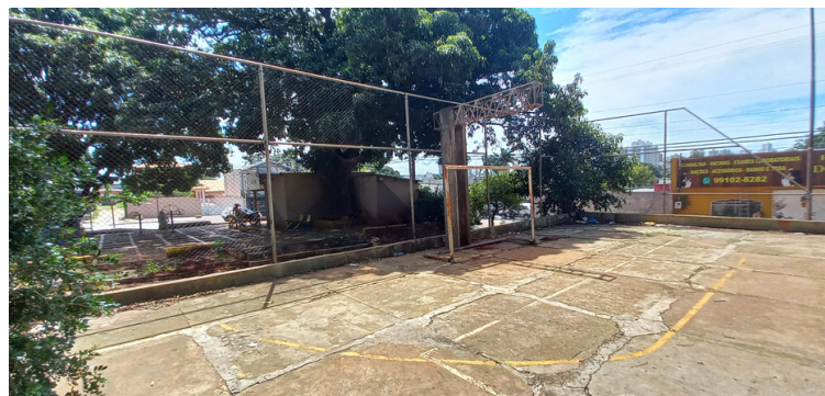
Foto 4 - Quadra esportiva com a pintura desgastada, piso com rachaduras e equipamentos incompletos.