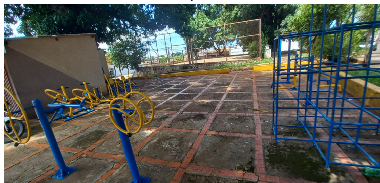
Foto 6 - Academia ao ar livre disponível à população.