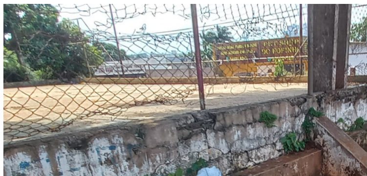
Foto 5 - Tela de proteção da quadra de esportes, danificada.