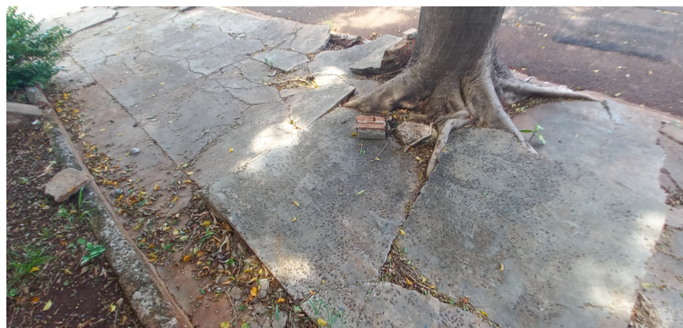
Foto 3 - Raízes de árvores prejudicando a estrutura da calçada.