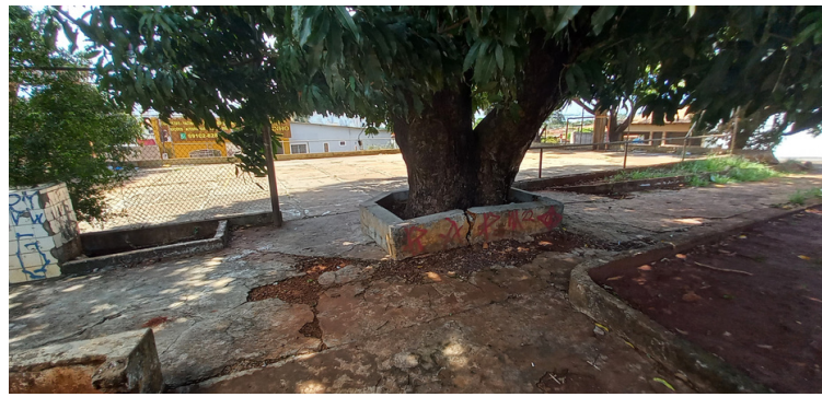
Foto 2 - Pavimento deteriorado.