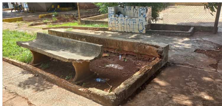
Foto 8 - Banco avariado.