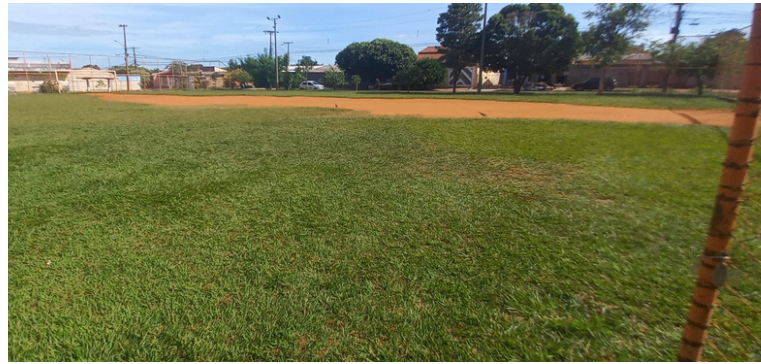
Foto 4 - Campo de futebol com o gramado desgastado.