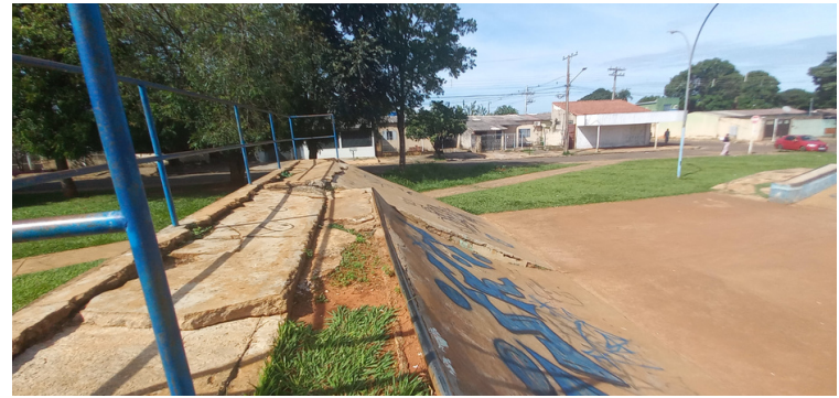
Foto 6 - Pista de skate com rachaduras evidentes.