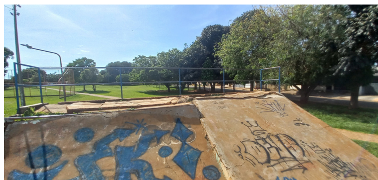
Foto 7 - Pista para a prática de skate vandalizada.