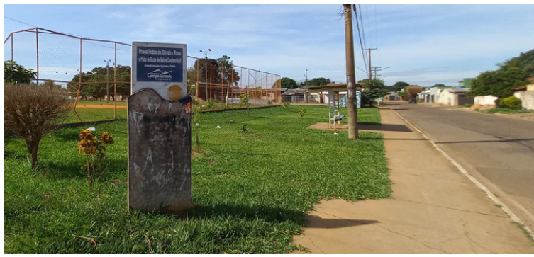
Foto 1 - Monumento da Praça Pedro de Oliveira Rosa, Coopavila II.