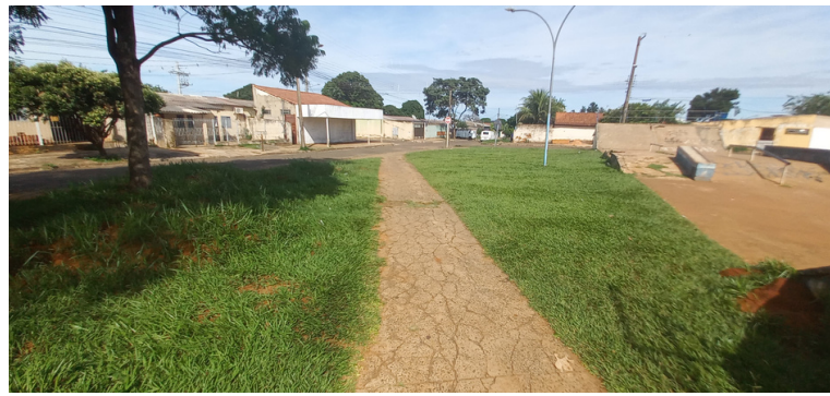
Foto 2 - Calçada com piso irregular e desníveis em vários pontos.