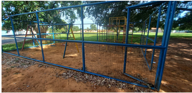
Foto 3 - Parque infantil com tela de proteção danificada.