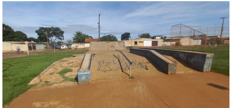
Foto 8 - Espaço para pratica de skate em condições precárias.