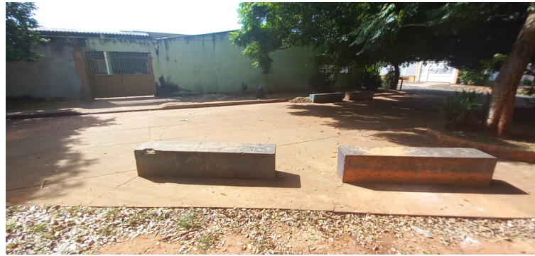
Foto 5 - Determinados bancos deteriorados.