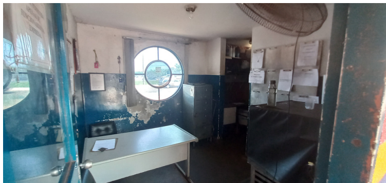
Foto 3 - Sala do administrativo isento da devida comodidade térmica, aparência desagradável e mobiliário insuficiente