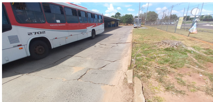
Foto 4 - Pavimento onde trafegam os ônibus com extensas rachaduras.