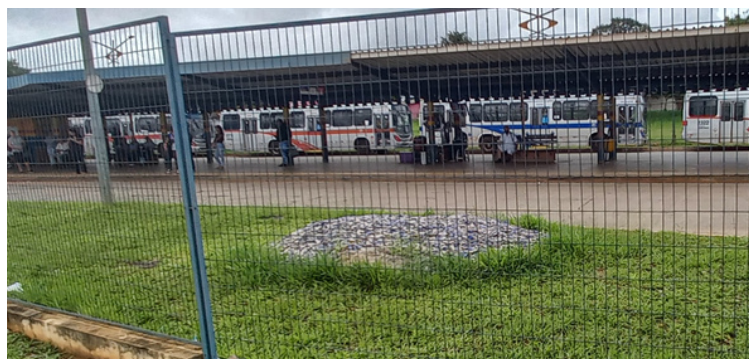
Foto 6 - Revestimento retirado da edificação, ainda encontra-se no local.