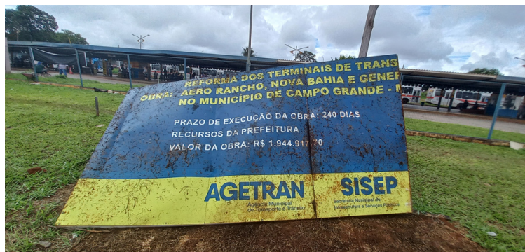
Foto 2 - Placa informativa da reforma, até o presente nunca realizada.