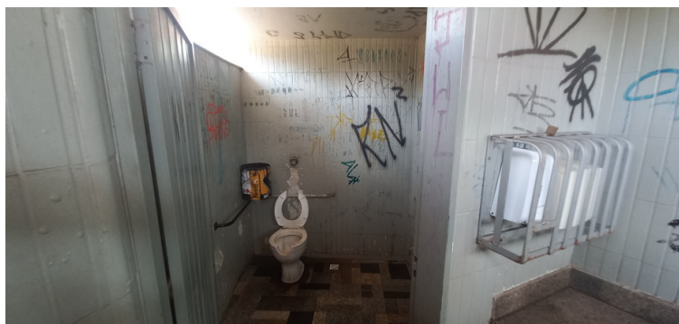
Foto 5 - Banheiros sem iluminação, inóspitos e repleto de pichações.