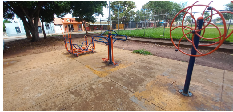
Foto 4 - Academia ao ar livre com equipamentos avariados.