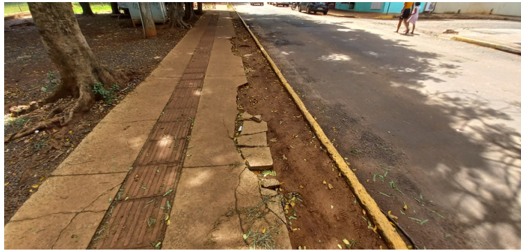
Foto 3 - Calçamento com o piso danificado.