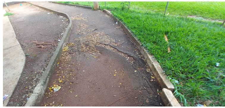
Foto 2 - Pista de caminhada com desniveis no pavimento.