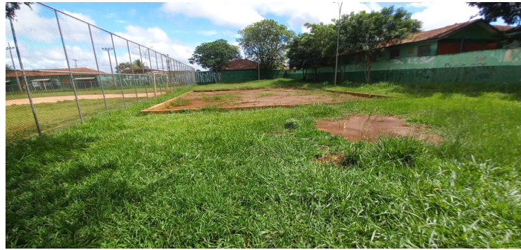
Foto 5 - Quadra de areia com mato alto e sem areia.