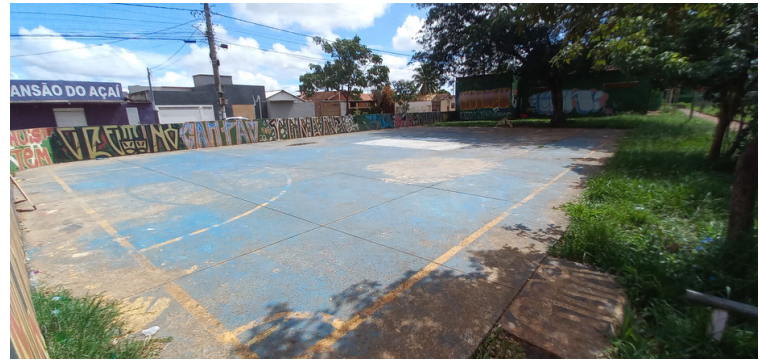
Foto 6 - Quadra poliesportiva com piso desgastado.