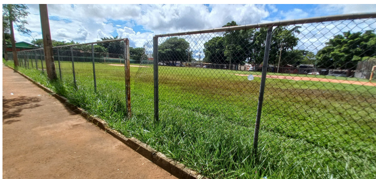
Foto 7 - Campo de futebol com alambrado avariado.