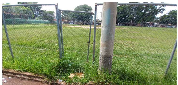
Foto 8 - Campo de futebol com portão deteriorado.