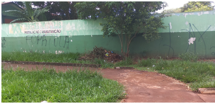
Foto 1 - Determinados pontos com entulho acumulado.