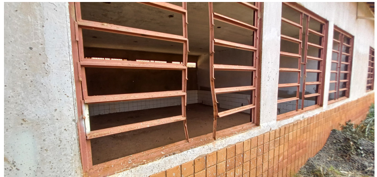
Foto 8 - Determinadas esquadrias sofreram tentativas de furto.