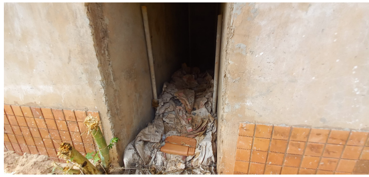
Foto 2 - Em determinados pontos há acúmulo de entulho.