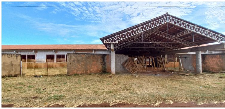
Foto 1 - Fachada da obra inacabada da Escola Municipal - Jardim Parati.