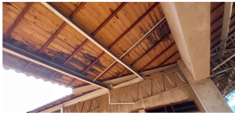
Foto 5 - Há pontos de infiltração pela obra.