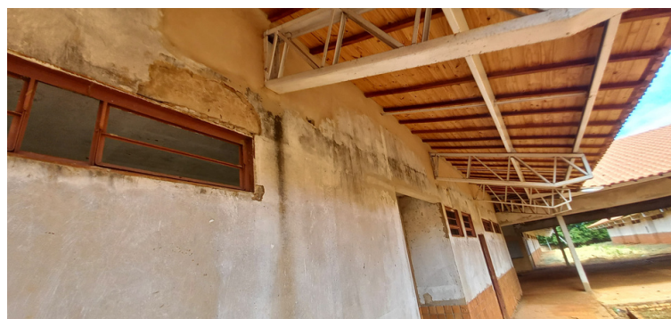
Foto 7 - As esquadrias estão enferrujadas.