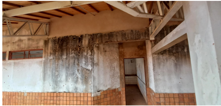
Foto 4 - Determinadas portas foram furtadas.