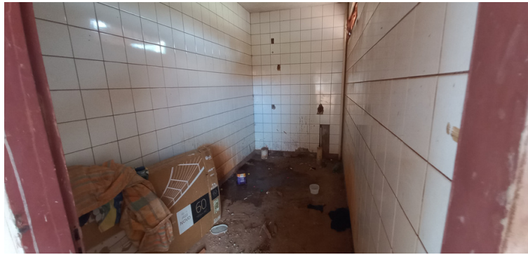
Foto 3 - A obra serve de abrigo para pessoas em vulnerabilidade.