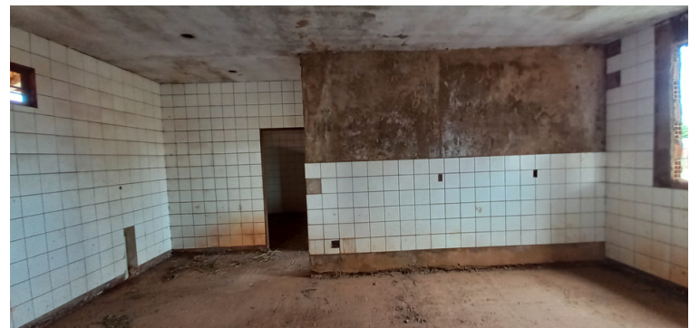
Foto 6 - A edificação apresenta bolor evidente.