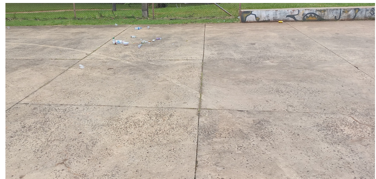
Foto 6 - Há locais com lixo espalhado.