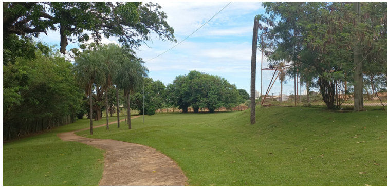
Foto 3 - Espaço amplo e aprazível para convivência social .