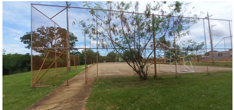
Foto 8 - Grade de proteção com avaria.