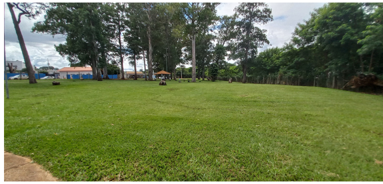
Foto 2 - Espaço bem arborizado.