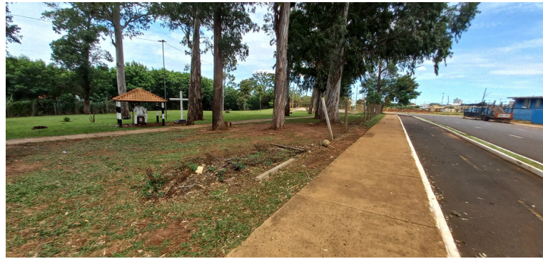
Foto 4 - Tela de proteção amassada e postes de sustentação caídos.