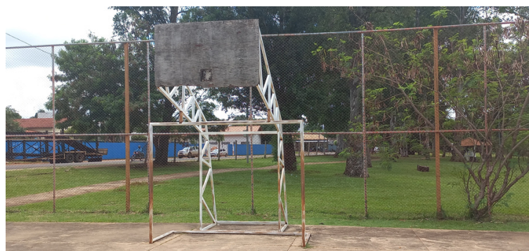
Foto 7 - Quadra poliesportiva sem a tabela para basquetebol.