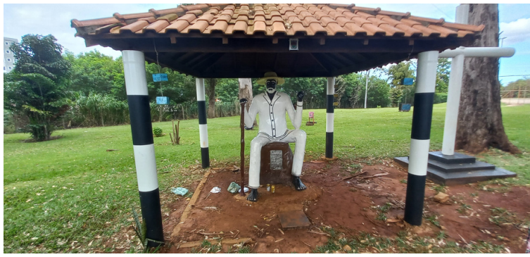
Foto 1 - Monumento da Praça dos Pretos Velhos, Jardim Paulista.