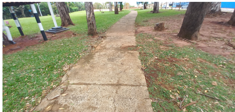
Foto 5 - Calçadas com pavimento com desníveis.