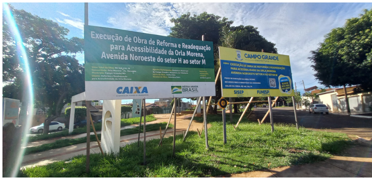
Foto 1 - Placa indicativa de obra no parque linear Orla Morena.