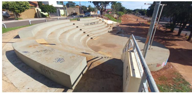
Foto 4 - Teatro de arena sem acessibilidade à pessoas com mobilidade reduzida.