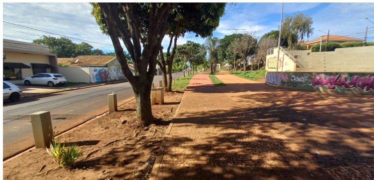
Foto 3 - Não há piso tátil em toda a extensão do parque.