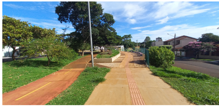
Foto 2 - Pontos que o piso tátil já foi implantado.