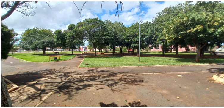
Foto 1 - Praça bem arborizada e com espaço amplo.