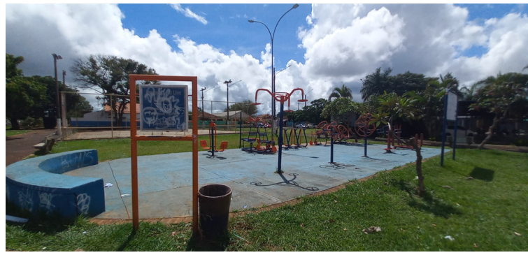
Foto 2 - Determinados pontos do espaço sofreram atos de vandalismo.