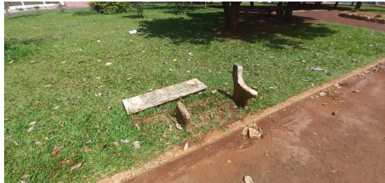
Foto 5 - Determinados bancos quebrados.