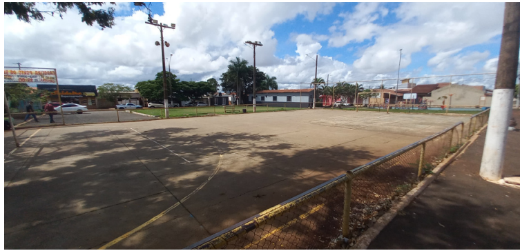
Foto 3 - Quadra de esportes com a pintura desgastada.