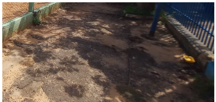
Foto 8 - Pista de caminhada com determinados locais com desníveis .