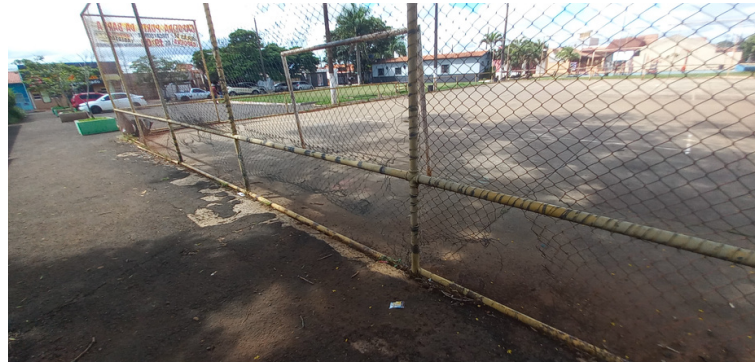
Foto 4 - Grade de proteção da quadra poliesportiva avariada.