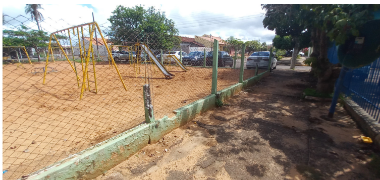
Foto 7 - Grade de proteção do parque infantil com pontos com avaria.