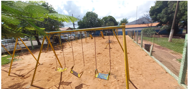
Foto 6 - Parque infantil com brinquedos danificados.