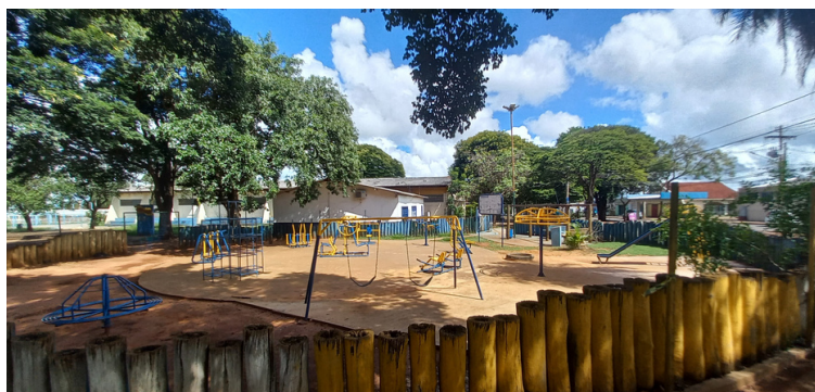
Foto 5 - Parquinho infantil propício à benfeitorias.