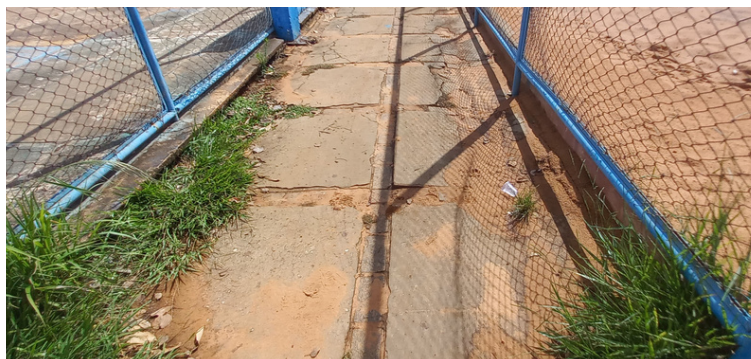
Foto 3 - Calçamento interno danificado, em locais pontuais.