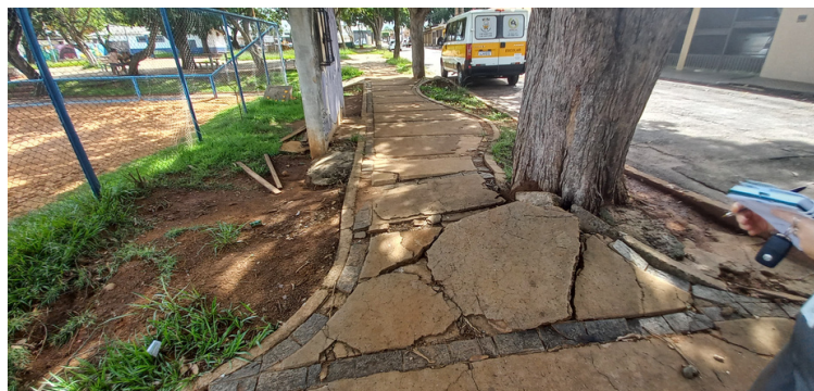
Foto 2 - Raízes de árvores danificando a estrutura da calçada, em determinados locais.