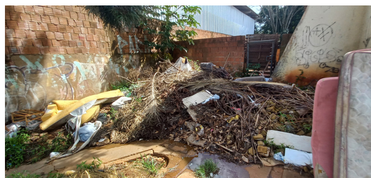
Foto 8 - Descarte irregular de entulhos, na parte posterior do espaço público.