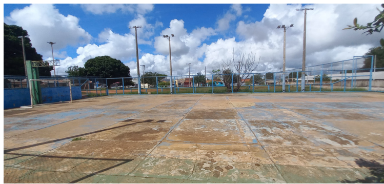
Foto 4 - Quadra poliesportiva com a pintura desgastada e piso danificado.