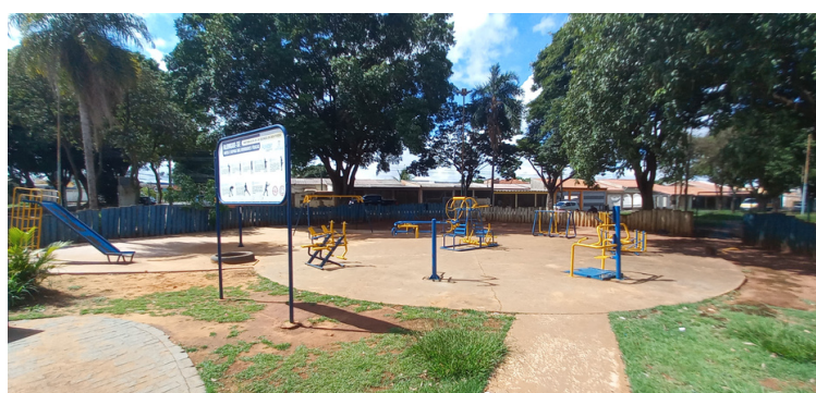
Foto 6 - Academia ao ar livre, em ótimo estado, disponível à população.