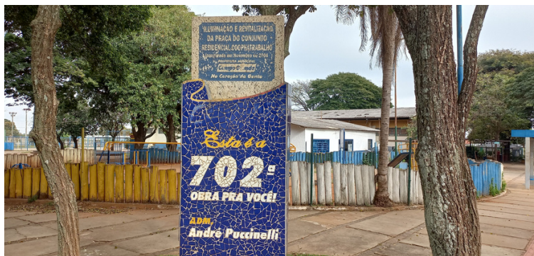
Foto 1 - Monumento da Praça Cooptrabalho - Iluminação e Revitalização.