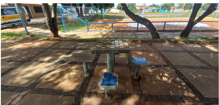
Foto 7 - Determinados bancos e mesas avariado.