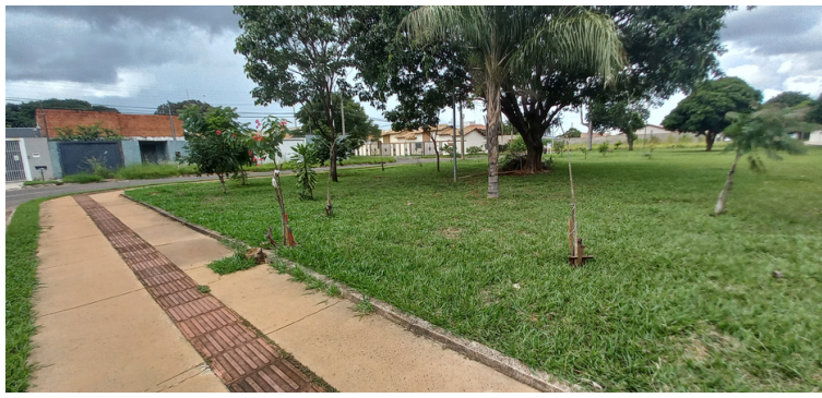
Foto 1 - Praça bem arborizada e com espaço amplo.