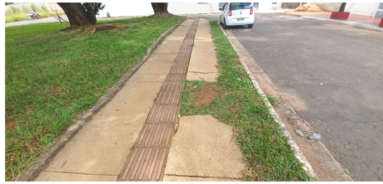
Foto 2 - Calçamento com desníveis.