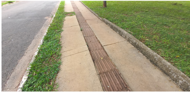
Foto 3 - Calçada com rachaduras.