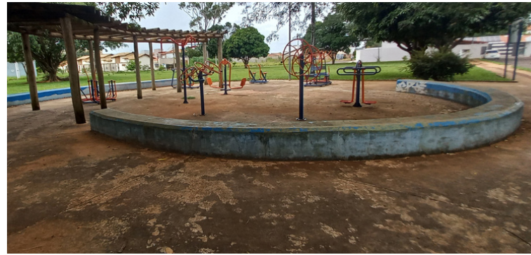
Foto 4 - Academia ao livre bem conservada.